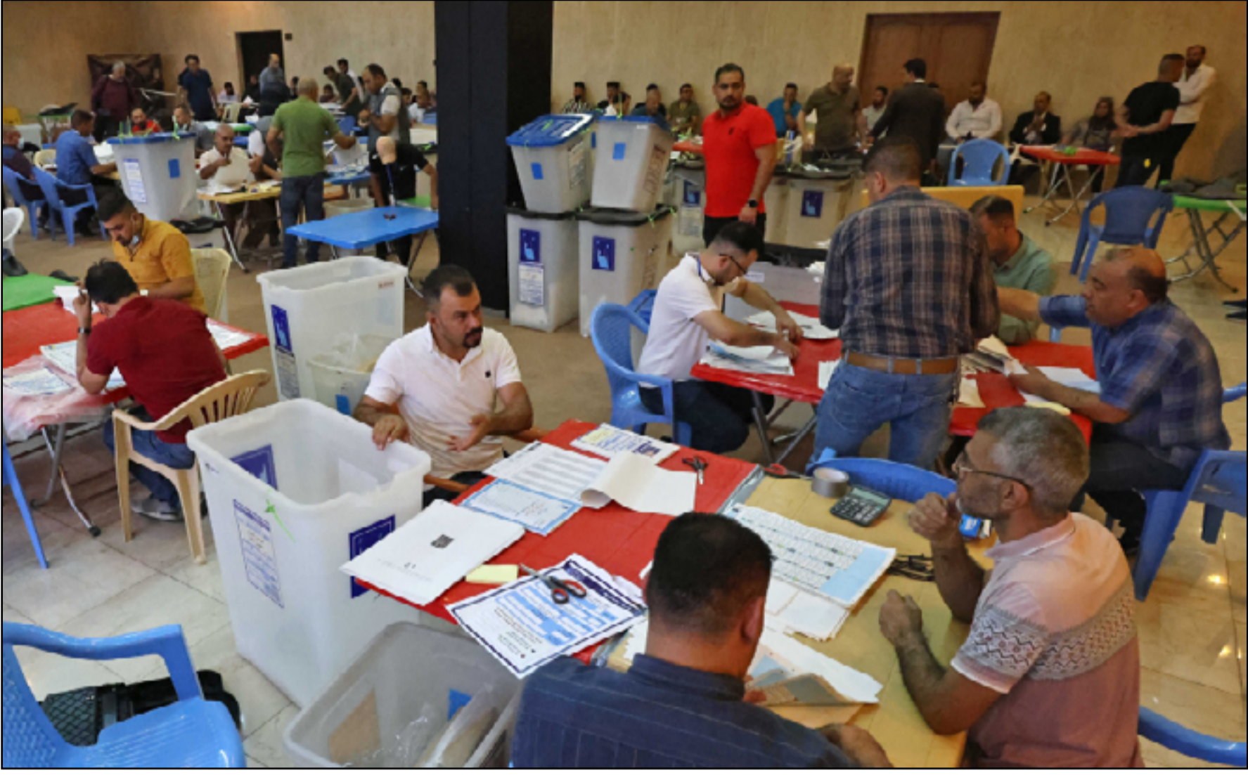
إحد مراكز العد والفرز لمفوضية الانتخابات

ويقود ركان الجبوري المحافظة بالوكالة منذ قرار حكومة حيدر العبادي رئيس