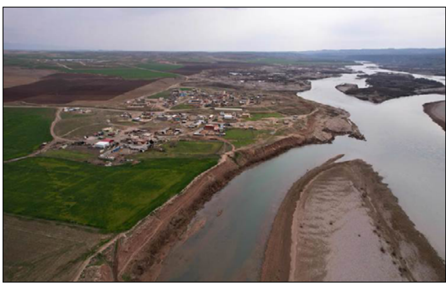
موسم شحيح ينتظر العراقيين في فصل الصيف

وتابع الموسوي، أن "العراق منحه هذا الملف بيد أعلى سلطة بعد أن فشل مفاوضه