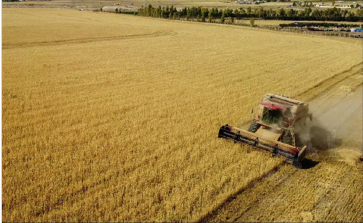
العديد من المزارعين يترقبون العودة إلى أراضيهم في المناطق المحررة

يشار إلى أن السوق الموازي ما زال يسجل ارتفاعاً مرتفعة في سعر صرف الدولار وهي أعلى مما هو معلن عنه رسمياً لدى البنك المركزي.