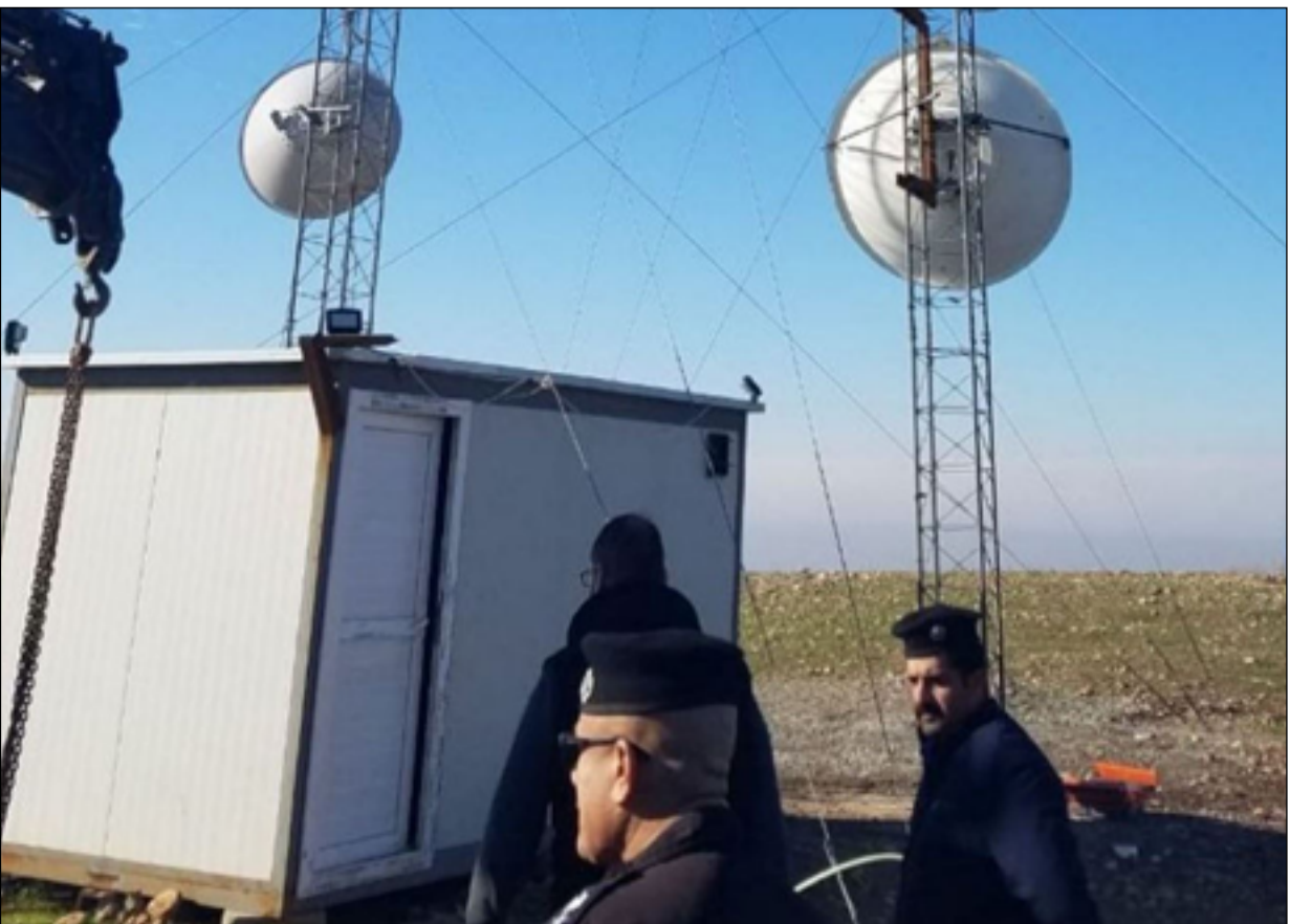
عمليات امنية مستمرة لملاحقة عصابات تهريب الانترنت