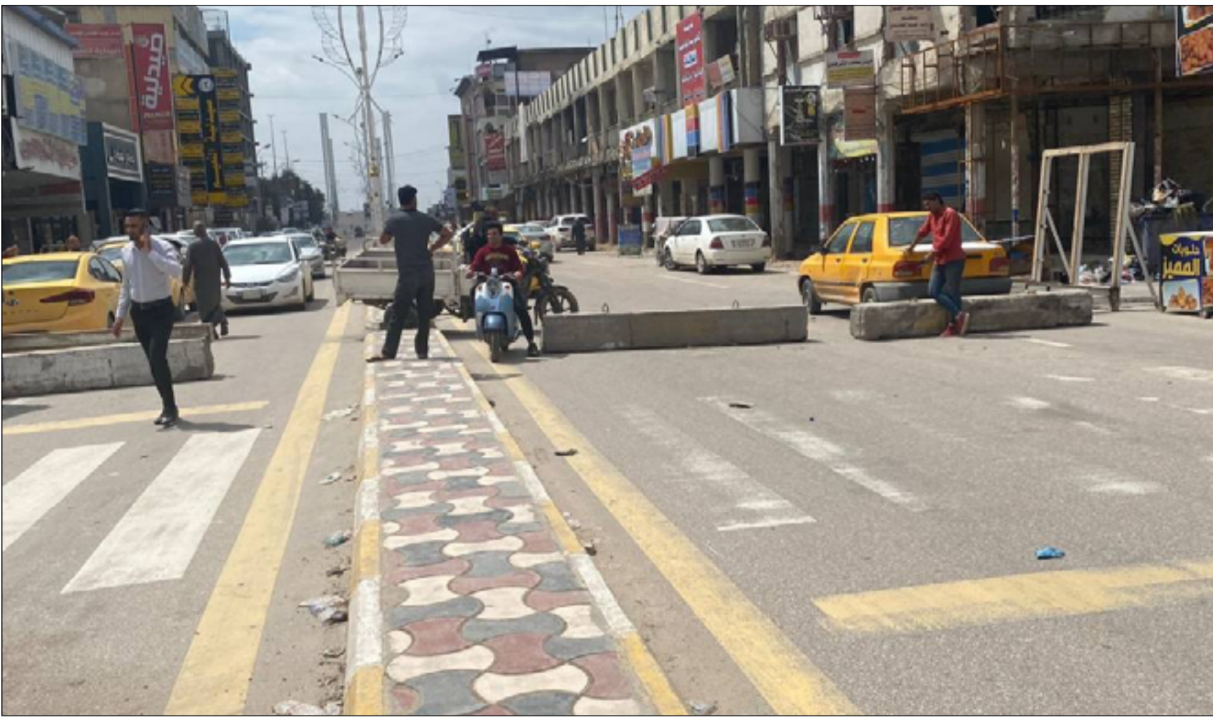
غلق الطرق المؤدية إلى ساحة الحبوب

الحوار التي نبتناها وندعو لها. وكانت مجموعة اماسي الشارع العراقي قد اعلنت في وقت سابق عن امسية ثقافية تقيمها مساء يوم الاثنين وتستضيف فيها رئيسة كتلة الجيل الجديد النائبة سرور عبد الواحد لمناقشة اخر المستجدات السياسية والرؤى والتصورات المستقبلية للمشهد السياسي العراقي.