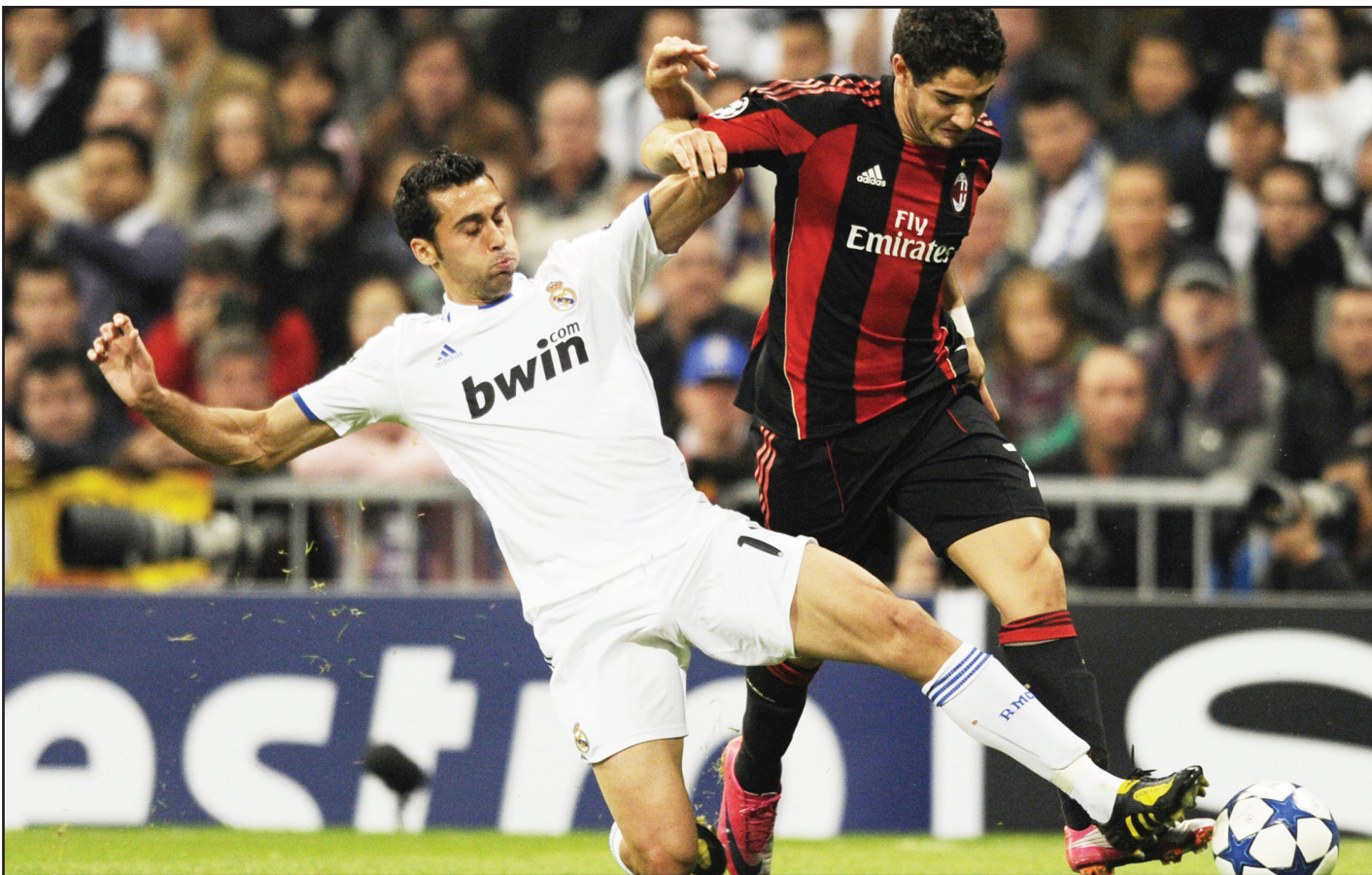
مواجهة مثيرة بين ميلان والريال

وكان ريال قد خسر في 5 مباريات على أرض ميلان قبل أن ينجح بالتعادل