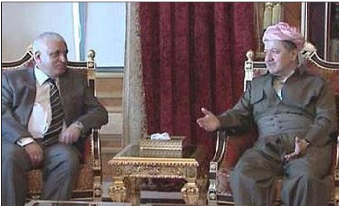
بارزاني مع الفياض

وتباحث معهما المشاكل العالقة بين أربيل وبغداد واكد الوفد ثلاث نقاط أساسية في لقاءه مع بارزاني، الأولى التأكيد لأكثر من مرة على تقييد وتقدير دور بارزاني في تدعيم العملية السياسية والديمقراطية بالعراق، وسعيه الدائم للتغلب على الخلافات والمشاكل التي تحدث بين الأطراف السياسية، مشيدين بجهوده المتواصلة مع جميع الأطراف للخروج من الأزمة السياسية الراهنة بالعراق، وأكدوا في النقطة الثانية التزام رئيس الوزراء العراقي بالنوايا الأساسية في مقدمتها الالتزام بالدستور، اما النقطة الثالثة فقد أكدوا التزامهم الكامل باتفاقية أربيل التي تمخض عنها تشكيل الحكومة الحالية، وشدوا في الشق المتعلق بمعالجة المشاكل العالقة بين أربيل وبغداد على ضرورة البحث عن آليات محددة للتواصل عبرها بغية الوصول إلى حسم تلك المشاكل.. وهو الموضوع نفسه الذي سيكون الوحيد في جدول أعمال اجتماع صلاح الدين الذي يعقد بين الكتل السياسية كافة الممثلة في برلمان كردستان. وكان قانون النفط والغاز الذي قدمته حكومة المالكي الى مجلس النواب قد اثار انتقادات واسعة في الاوساط الكردية، مما اعتبرته الكتلة الكردستانية في البرلمان خرقا دستوريا ادى الى توتر العلاقة بين اربيل وبغداد التي ما زالت تشهد الكثير من المشاكل بسبب "تجميد" اتفاقية اربيل