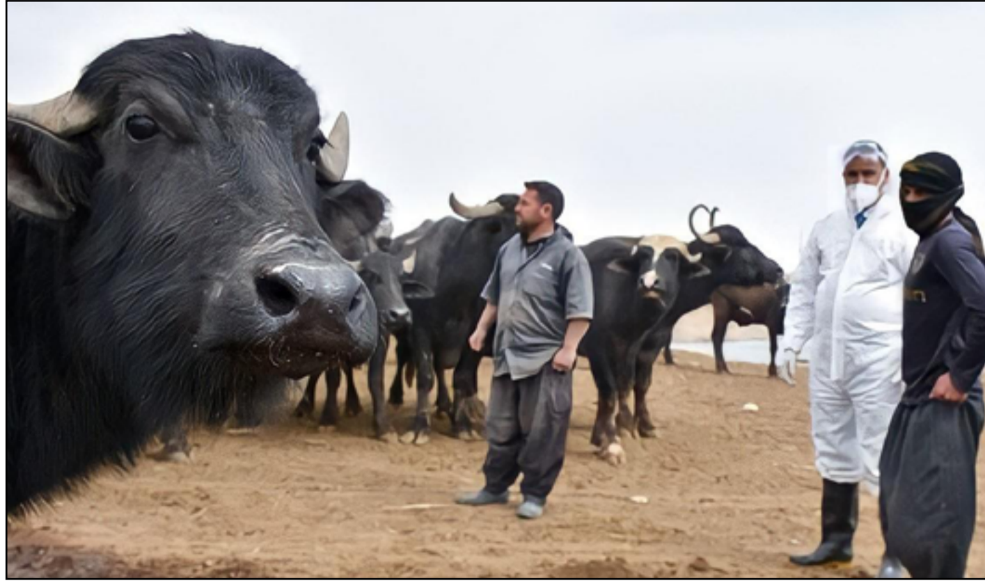
خطر الحمى النزفية في تصاعد مستمر

أفادت وزارة الصحة بعدم وجود سيطرة على الحشرة الناقلة للحمى النزفية لغاية الوقت الحالي، داعية الجهات المختصة إلى ملاحقتها والقضاء عليها، مشددة على ضرورة اعتبار جميع اللحوم مصابة بالفايروس، مجددة المطالبة بأهمية الكشف المبكر من قبل المصابين عن حالاتهم.