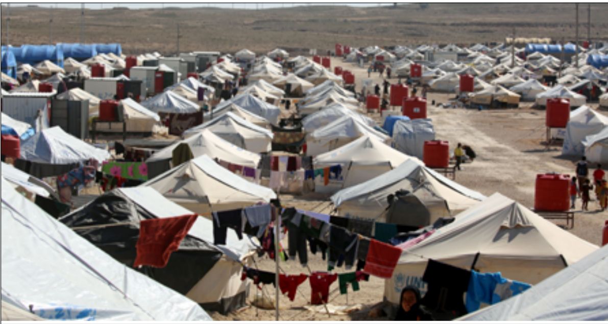
مخيم الهول قبلة موقوتة تهدد العراق ودول المنطقة