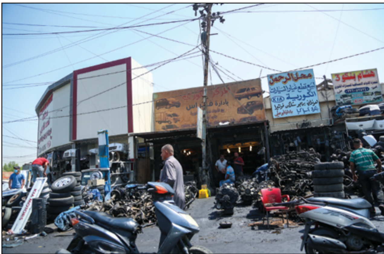
ما زالت الكثير من المحلات الصناعية تتجاوز على الارصفة العامة.. عداة: محمود رؤوف