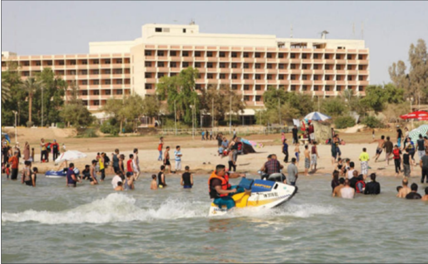
بحيرة الحبانية تعد من أبرز المعالم السياحية في العراق

يوم ما تغمرها المياه". ويعود الدليمي، وهو يتذكر أيام البحيرة في الماضي، ليقول، إن بيتنا كان يبعد ١٥ متراً عن البحيرة، كانت مياهها عذبة وفيرة". وتابع الدليمي، أن السفرات السياحية المزورة كانت على مدار السنة، وكثير من سكان المنطقة كانوا يعيشون على صيد السمك، اما الآن فكل ذلك قد انتهى".