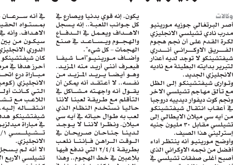
مورينو يترقب أداء أفضل من شيفتشينكو

يكون. إنه قوي بدنيا ويصارع في كل جوانب اللعبة.. إنه يسجل الأهداف ويعمل في الدفاع والهجوم ويساعد في صنع الهجمات - كل شيء". وأضاف مورينو "أما شيفا فيعرف أنني أريد منه المزيد. وهو أيضا يريد المزيد من نفسه.. لا اعتقد أنه يمكن أن يقول أنه واجهته مشاكل في التأقلم مع طريقة لعبنا لأننا حاليا نستخدم النظام الذي لعب به طوال حياته في آيه سي ميلان. ونظرا لأننا لا يوجد لدينا جناحان صريحان في الوقت الراهن فإننا نلعب بطريقة ٢/٤/٤ التي تدفع فيها اللاعبين في خط الهجوم.. وهذا بالضبط ما كان يفعله شيفا في ميلان". الآن مورينو أكد أن شيفتشينكو الذي يتقاضى ١٣ ألف جنيه إسترليني أسبوعيا لاعب مذهل تماما وأبدى ثقته