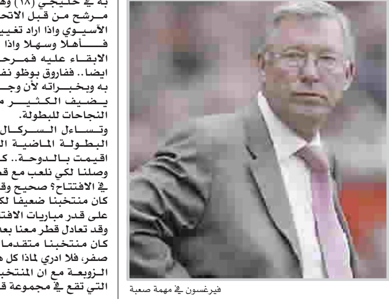
فيرغسون في مهمة صعبة

لندن / الوكالات يتوقع السير اليكس فيرغسون - المدير الفني لنادي مانشستر يونايتد - ان يكون السباق للوزن بالدوري الإنجليزي الممتاز لكرة القدم ان يكون اكثر صعوبة بعد خسارة كل الفرق الاربعة الكبيرة النقاط في المراحل الأولى من جولات الدوري الإنجليزي. و خسر مانشستر يونايتد في المباراة الأخيرة له في الدوري من نادي ارسنال الإنجليزي بنتيجة ١-٠ بعد المنافسة الحادة في جميع مبارياته الاربعة الأولى مما جعله يحرز لقب الدوري الممتاز. وقال السير اليكس فيرغسون: "انه دوري صعب جدا، تشيلسي خسر مباراة، ليفربول خسر مباراتين، ارسنال خسر مباراة، ونحن الان خسرنا ايضا مباراة، هذا الامر يعكس صورة البريميرليغ الان، الدوري لن يكون سهلاً بعد