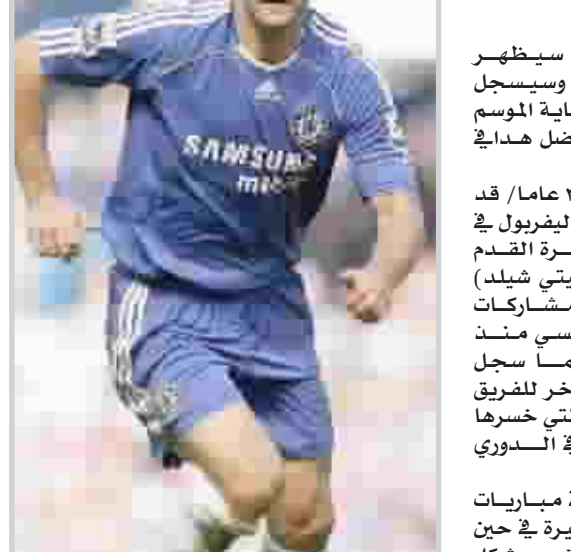
مورينو يترقب أداء أفضل من شيفتشينكو

يكون. إنه قوي بدنيا ويصارع في كل جوانب اللعبة.. إنه يسجل الأهداف ويعمل في الدفاع والهجوم ويساعد في صنع الهجمات - كل شيء". وأضاف مورينو "أما شيفا فيعرف أنني أريد منه المزيد. وهو أيضا يريد المزيد من نفسه.. لا اعتقد أنه يمكن أن يقول أنه واجهته مشاكل في التأقلم مع طريقة لعبنا لأننا حاليا نستخدم النظام الذي لعب به طوال حياته في آيه سي ميلان. ونظرا لأننا لا يوجد لدينا جناحان صريحان في الوقت الراهن فإننا نلعب بطريقة ٢/٤/٤ التي تدفع فيها اللاعبين في خط الهجوم.. وهذا بالضبط ما كان يفعله شيفا في ميلان". الآن مورينو أكد أن شيفتشينكو الذي يتقاضى ١٣ ألف جنيه إسترليني أسبوعيا لاعب مذهل تماما وأبدى ثقته