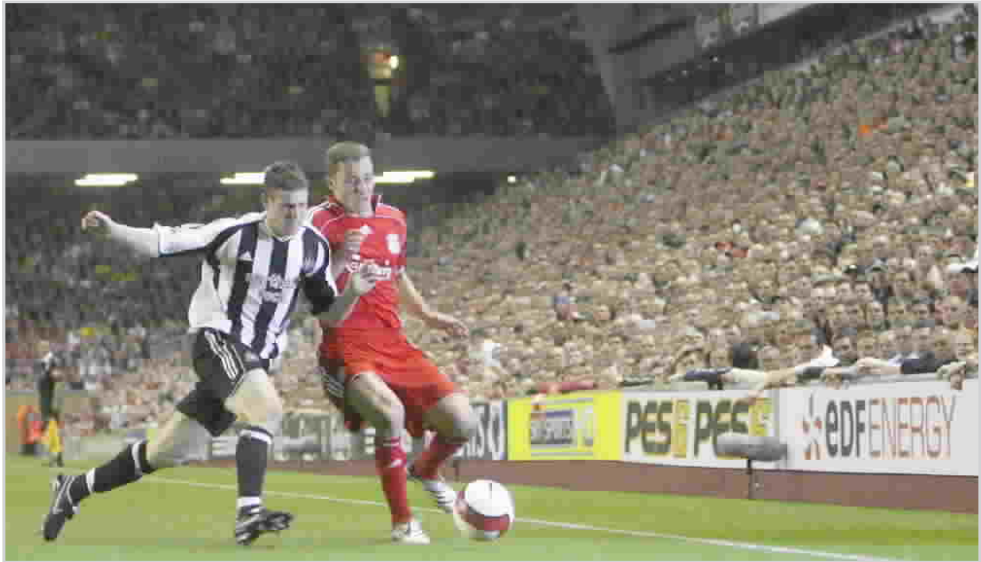
جمهور انفيلد تفاعل مع فوز ليفربول على نيوكاسل (٢-صفر)

بولينا / DPA سيرشح فرانتز بكنباور نفسه مجدداً لرئاسة نادي بايرن ميونيخ الألماني لكرة القدم في الانتخابات التي تجرى في تشرين الثاني المقبل. وقال بكنباور إنه ربما يترشح أيضاً لتولي منصب الرئيس التنفيذي للاتحاد الدولي لكرة القدم (فيفا) في مطلع العام المقبل. وقال بكنباور ٦١ عاماً/ الذي يرأس بايرن ميونيخ منذ عام ١٩٩٤ إنه سيستقيل وقتما يشعر خليفته المعين المدير العام للنادي أولي هونيس بأنه مستعد لتولي الرئاسة. وصرح بكنباور في حفل رعاه بمدينة نورمبرج قائلاً "إنه شيء جيد تماماً أننا الآن نتعاون معاً في أحداث كرة القدم". ويريد الاتحاد الألماني للعبة أيضاً أن يحل بكنباور مكان جيرهارد ماير فورفيلدر (رئيس الاتحاد المنتهية رئاسته) في اللجنة التنفيذية بالفيفا ابتداء من كانون الثاني المقبل. وقال بكنباور "إنني متأكد من أنه يمكنني عمل شيء ما لكرة القدم الألمانية والأوروبية". واعترف بكنباور الذي كان رئيساً للجنة المنظمة لكأس العالم ٢٠٠٦ في ألمانيا بأنه منذ المباراة النهائية لكأس العالم والتي أقيمت في التاسع من تموز الماضي "لم أتمكن من رؤية كرة قدم أخرى". وعاد بكنباور الفائز بكأس العالم عام ١٩٧٤ لاعباً وعام ١٩٩٠ مدرباً إلى استادات كرة القدم للمرة الأولى بعد كأس العالم ٢٠٠٦ يوم الأربعاء الماضي ليتابع المباراة بين هامبورج وأرسنال الإنجليزي في دوري أبطال أوروبا. وقال بكنباور "والآن عادت إثارة كرة القدم مرة أخرى".