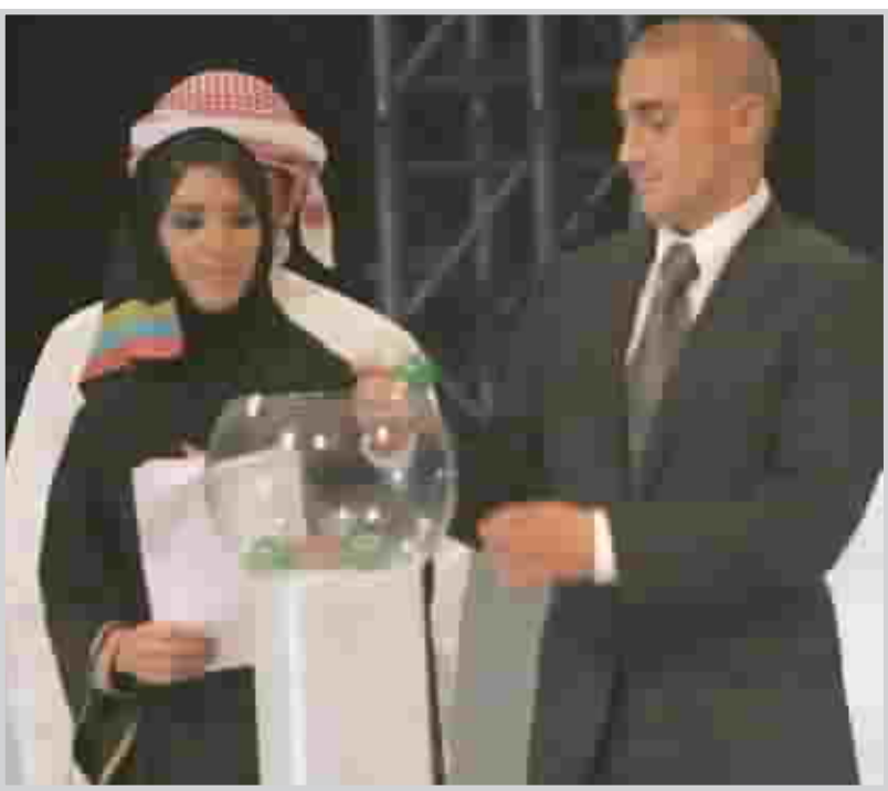
كانافارو اثناء مشاركة في حفل القرعة

يومها إشارة أي شكوك لذلك فضلنا تأجيل الحديث في الموضوع". وأضاف "نتمنى أن تكون القرعة دائماً منصفة والكل يشهد بأنه لم تسجل أي اعتراضات في الدورة التي أقيمت في قطر سواء على القرعة أو غيرها، وللأسف أن مثل هذه الملاحظات تسهم في إفقاد الدورة بعضاً من برقيتها، علماً بأننا سنسجل اعتراضا الرسمي وسندع الأمر للجنة المنظمة في الإمارات والتي نطلب منها الرجوع للشروط وإذا كانوا يرون أن ما حدث منصف فهذا أمر يعود لهم ونحن نقبل بحكمهم". وعن حطوظ المنتخب القطري حامل لقب البطولة الأخيرة في الحفاظ على لقبه، قال: "جميع مباريات دورات الخليج تكون صعبة للغاية والجميع ينظر لنا على أننا أبطال الدورة السابقة ولا يمكن في دورات الخليج النظر إلى الماضي والاعتماد عليه، وعلى سبيل المثال فالمنتخب العراقي الذي شارك في خليجي ١٧ والذي كان مرشحاً بقوة للقب بعد إحرازه المركز الرابع في دورة الألعاب الأولمبية التي أقيمت في مدينة أثينا اليونانية احتل المركز السابع وقبل الأخير، والمنتخب الـ ٨ المشاركة في البطولة باستثناء المنتخب اليمني مستواها متقارب لفضول باللقب على اعتبار أنه صاحب الأرض والجمهور وهما عاملان مهمان لدعم أي منتخب".