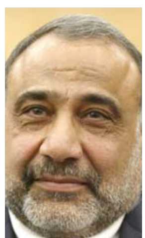
عادل عبد المهدي

مجلس النواب بالإشراف والمراقبة على العملية الانتخابية ومتابعة ورقة قواعد السلوك الانتخابي التي قدمها مجلس الرئاسة الى مجلس النواب مؤخرا، بالإضافة الى قضية المياه وضرورة فتح هذا الملف بكل ابعاده وتحديد دور الجانب العراقي وجانب دول الجوار.