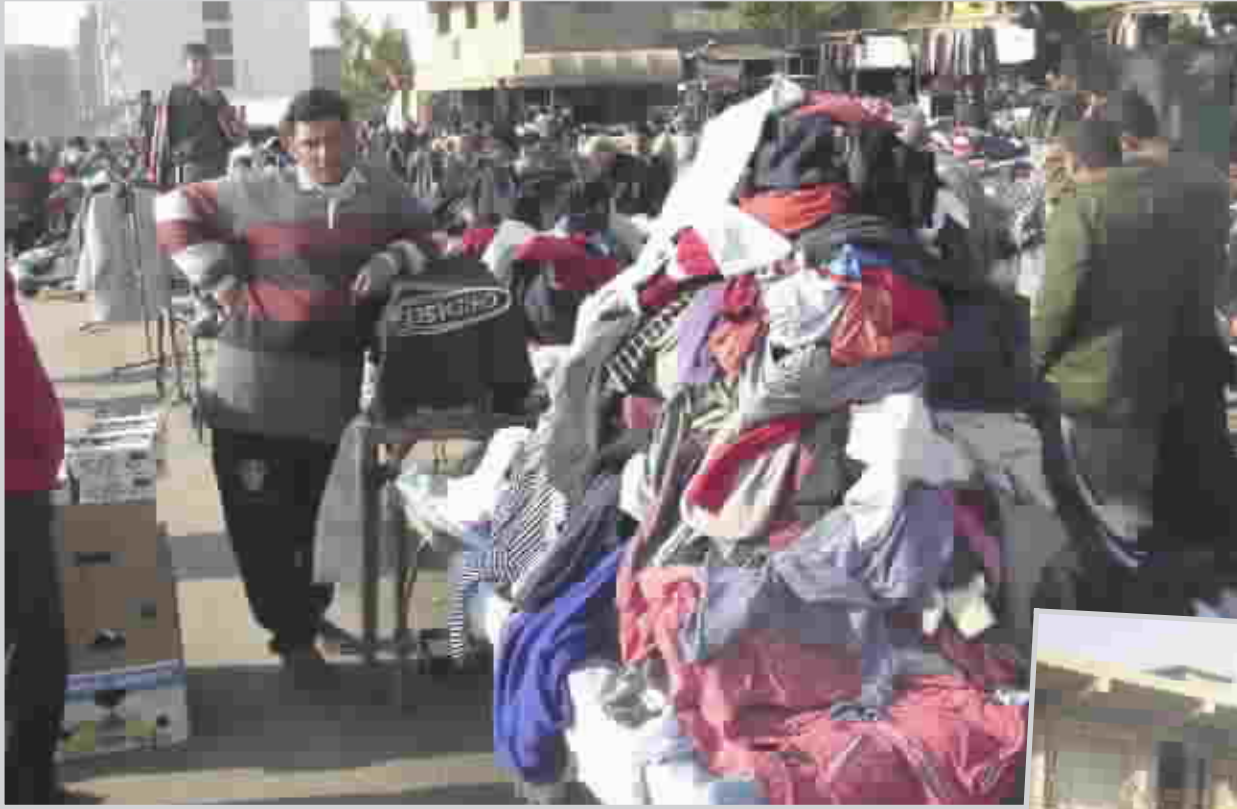
أحد أسواق الملابس المستعملة (البالات) في بغداد

كثيرا كانت ميدالية فضيه بغاية الجمال وشكلها مميز وقد عرض على المال إلا أنني لم أبيعها ومازلت احتفظ بها وليس هذا وحسب بل أن بعض الأشخاص ومنهم بانعو الملابس المستعملة حصلوا على قطع نقدية دولية مثل العملات الأجنبية والعملات الخليجية وأحياناً على قطع من الذهب.