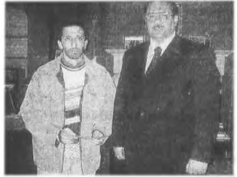
السفير العراقي في الجزائر يسلم الشاعر الجزائري منحة الصندوق