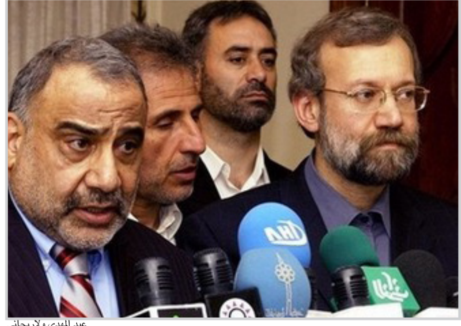
عبد المهدي ولاريجاني

تجاوز مرحلة مهمة ويمكنه ان يلعب دورا مهما في المنطقة كما يمتلكه من امكانات وطاقت كبيرة. وحذر من ان هناك بعض القوى تريد ان تدق اسفنجيا في العلاقات بين البلدين الجارين.