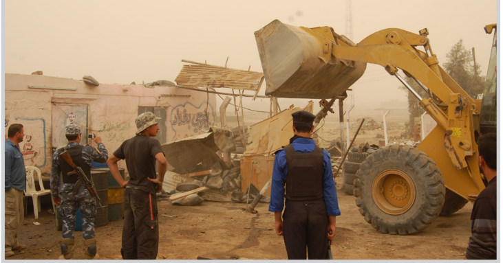
ترحيل اصحاب المحال من امكانهم

وقال رئيس اتحاد نقابات العمال سعد الشلاه: ان هذا القرار هو قرار جائر من قبل الحكومة المحلية لترحيل كراجات السيارات واصحاب المحال التجارية في الحلة ويخلق حالة من التذمر بين المواطنين والمتسوقين في سوق الحلة الكبير ونحن مستعدون في منطقة السوق الكبير لفسح المجال امام سوق القطع الخاص للعمل ورفع الحواجز