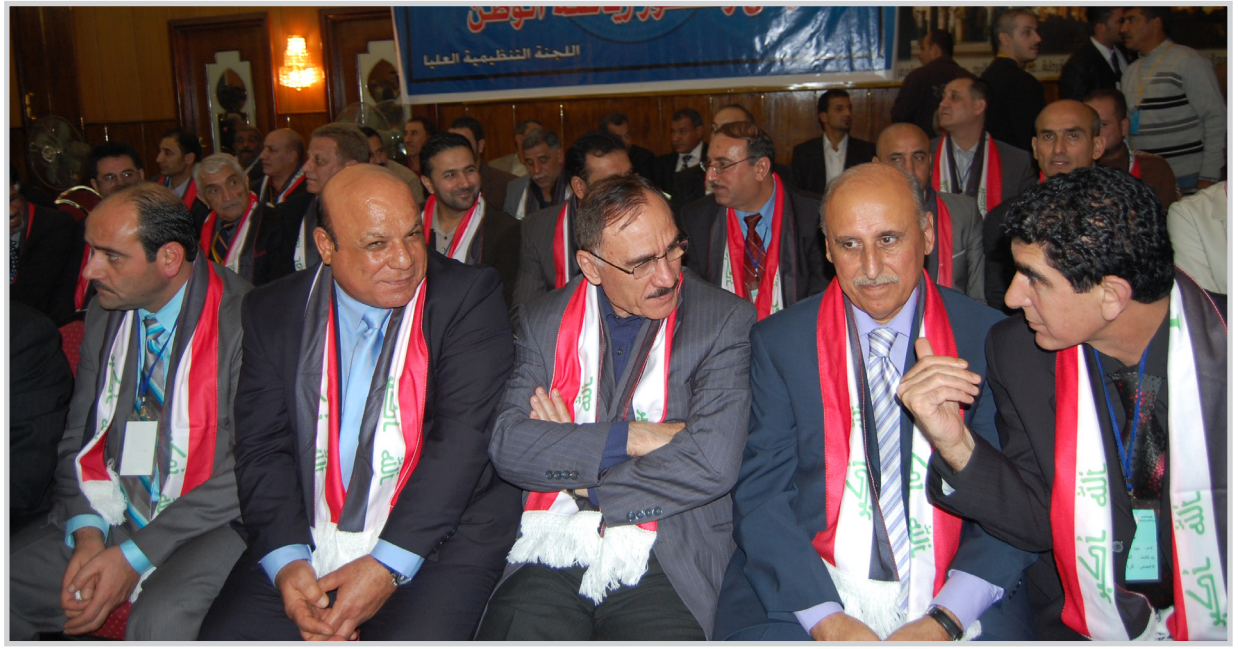
المغتربون يناقشون أزمة تعليق أنشطة الكرة العراقية دولياً