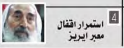
استمرار اعتقال معبر ايريز