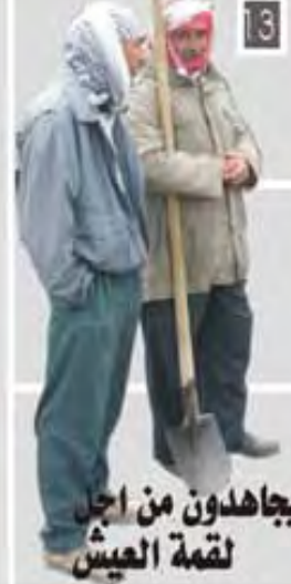
العمال يجاهدون من أجل لقمة العيش