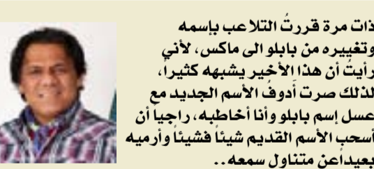
ذات مرة قررتُ التلاعب بإسمه وتغييره من بابلو الى ماكس، لأنني رأيتُ أن هذا الأخير يشبهه كثيراً، لذلك صرت أدرف الاسم الجديد مع غسل إسم بابلو وأنا أخطبه، راجياً أن أسحب الاسم القديم شيئاً فشيئاً وأرميه بعيداً عن متناول سمعه..

بالييت المدى الذي صار صديقي دون أن أدري، وبالجهد الطبيعي وعادات الكلاب، وليسامحتي على عدم درايتي، بعد أن تكونت بيننا هذه الصحبة، حتى صرتُ لا أبدأ يومي إلا بعد أن ألمحه من خلال بعض الفتحات التي أحدثها في السياج الأخضر وهو يتقافز ويدعو مع خطواتي لبدء يومه الجديد، لأقتنع أخيراً وبشكل نهائي بأن إسم بابلو ليس ملائماً له فقط، بل ويمكنني أن أضيف له بيكاسو أيضاً.