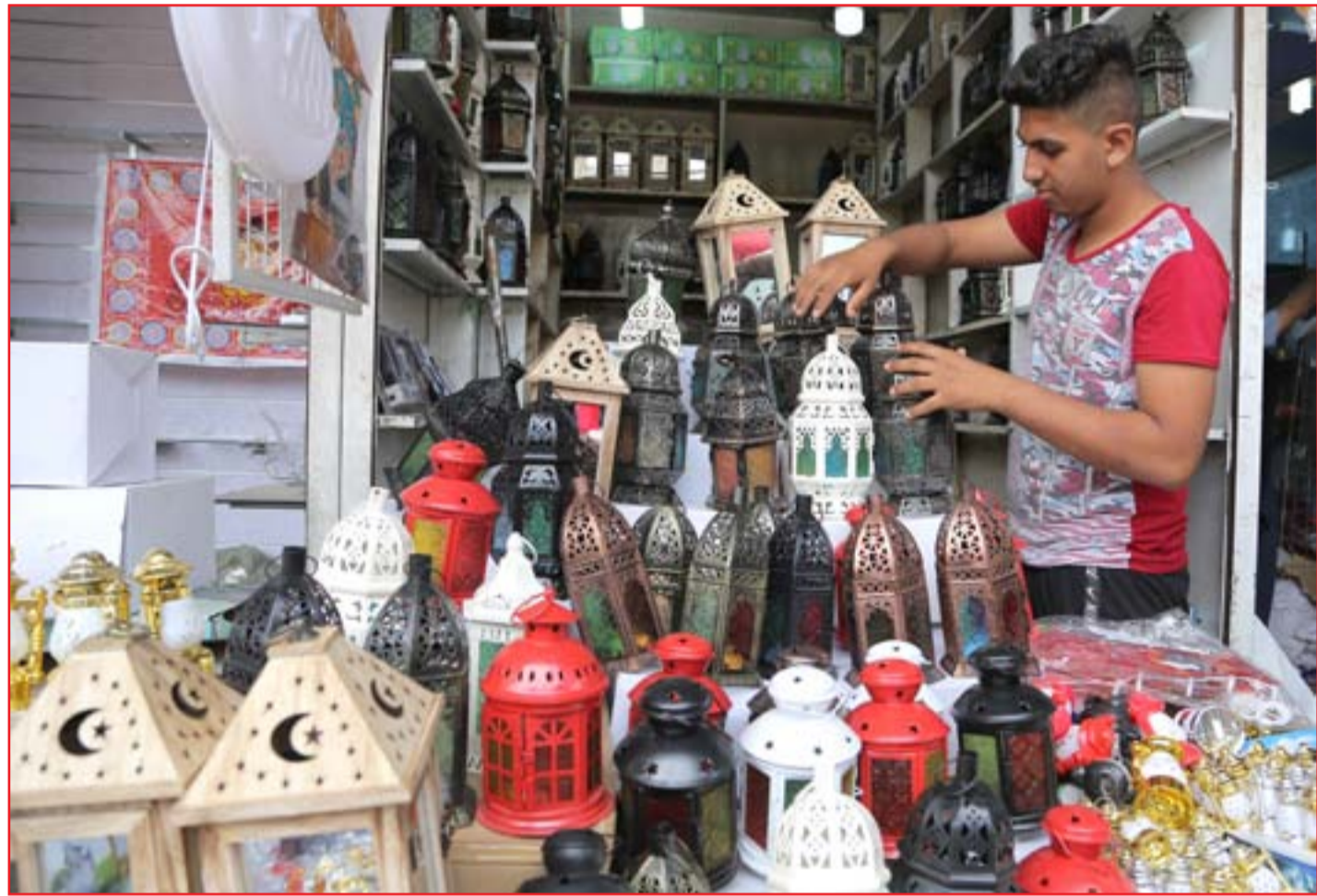
تجهيزات رمضان تُرَقق الأسواق...

شاحنة بجوار شاحنة، مخفر حدودي بجوار مخفر حدودي آخر، انها حالة صراع ما بين العراق وايران بدأت تظهر للعيان حول متى سيتم فتح المعابر الحدودية بين البلدين، حيث اقدم العراق على اغلاقها قبل خمسة اسابيع