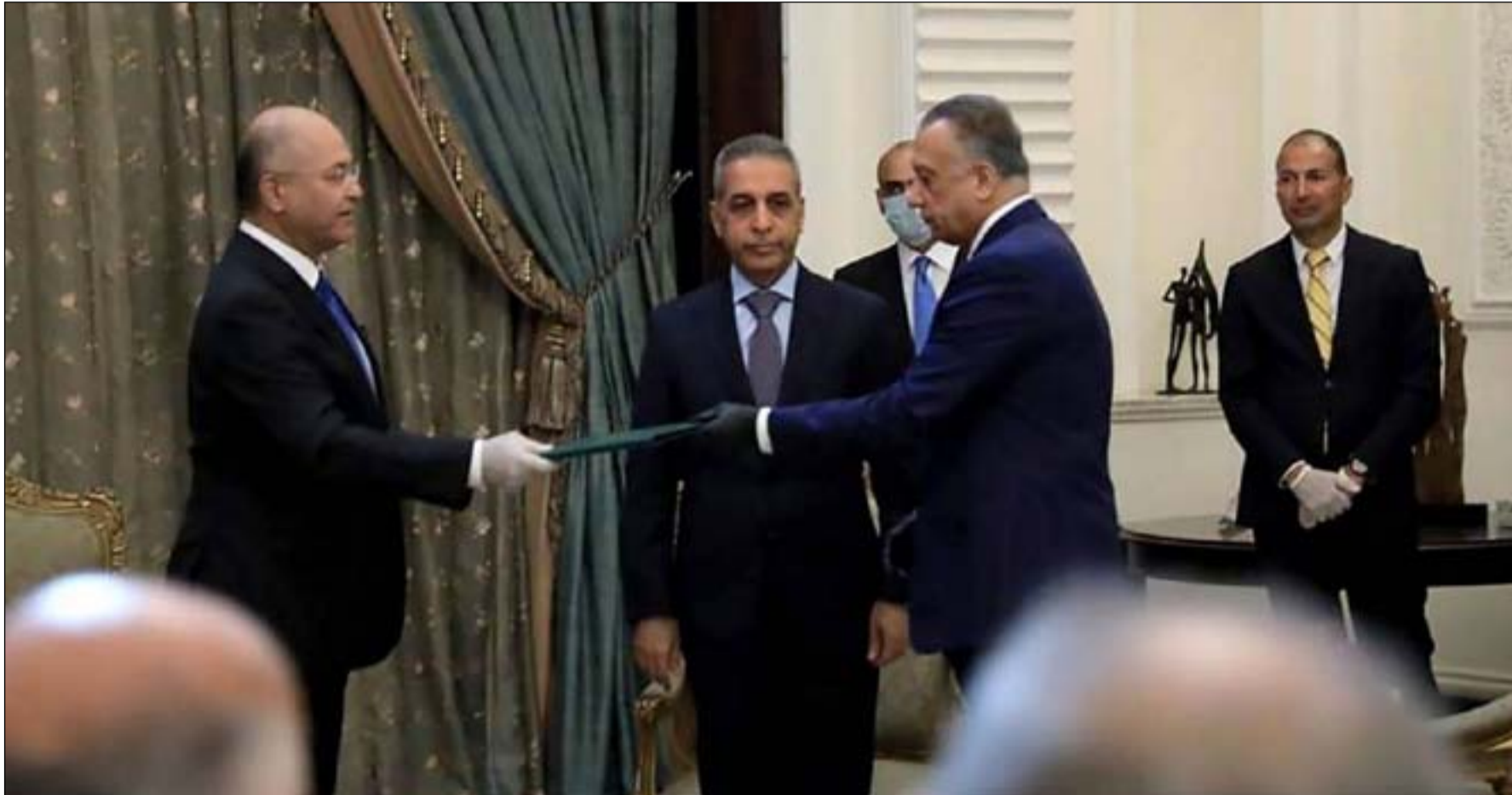
جانب من اجتماع تكليف الكاظمي

أكد رئيس الجمهورية برهم صالح، أمس الاحد، على ضرورة ترشيح العناصر الكفوءة والنزيهة في تشكيل الحكومة الجديدة، فيما شدد على أهمية توحيد الجهود بين القوى السياسية لحسم ملف الترشيح. ويستعد رئيس مجلس الوزراء المكلف مصطفى الكاظمي لإعادة التفاوض مع القوى السنية والكرديّة لتجاوز مشكلة تحفظ الكتل الشيعية على مرشحين ضمن قائمته الوزارية. وخيرت الكتل الشيعية المكلف بين استبدال مرشحين بشخصيات جديدة، أو سحب تخويلها الذي منحها اياه في وقت سابق لاختيار طاقمه الوزاري.