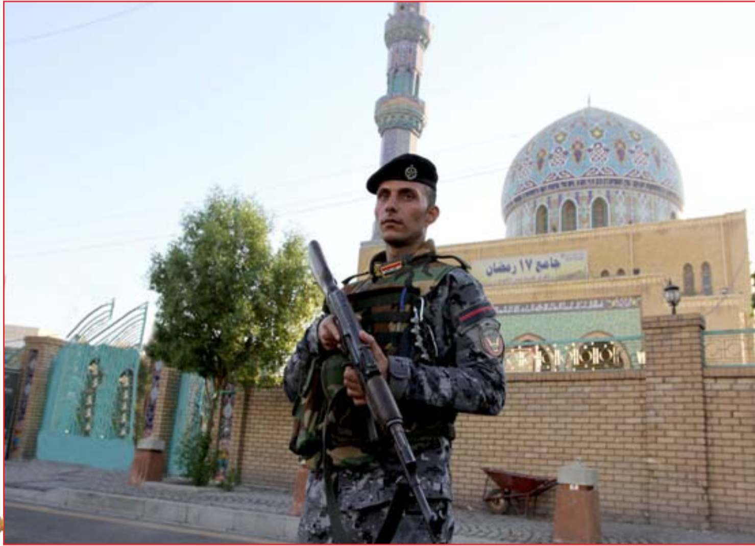
الجموع مغلقة في رمضان لأول مرة في تاريخها ..

أعلن وزير التخطيط في حكومة إقليم كردستان، دارا رشيد، أمس الأحد، استعداد حكومته لتسليم بغداد ٢٥٠ ألف برميل يومياً والملف النفطي بالكامل، بشرط صرف المستحققات المالية للإقليم. وقال رشيد في مؤتمر صحفي مشترك