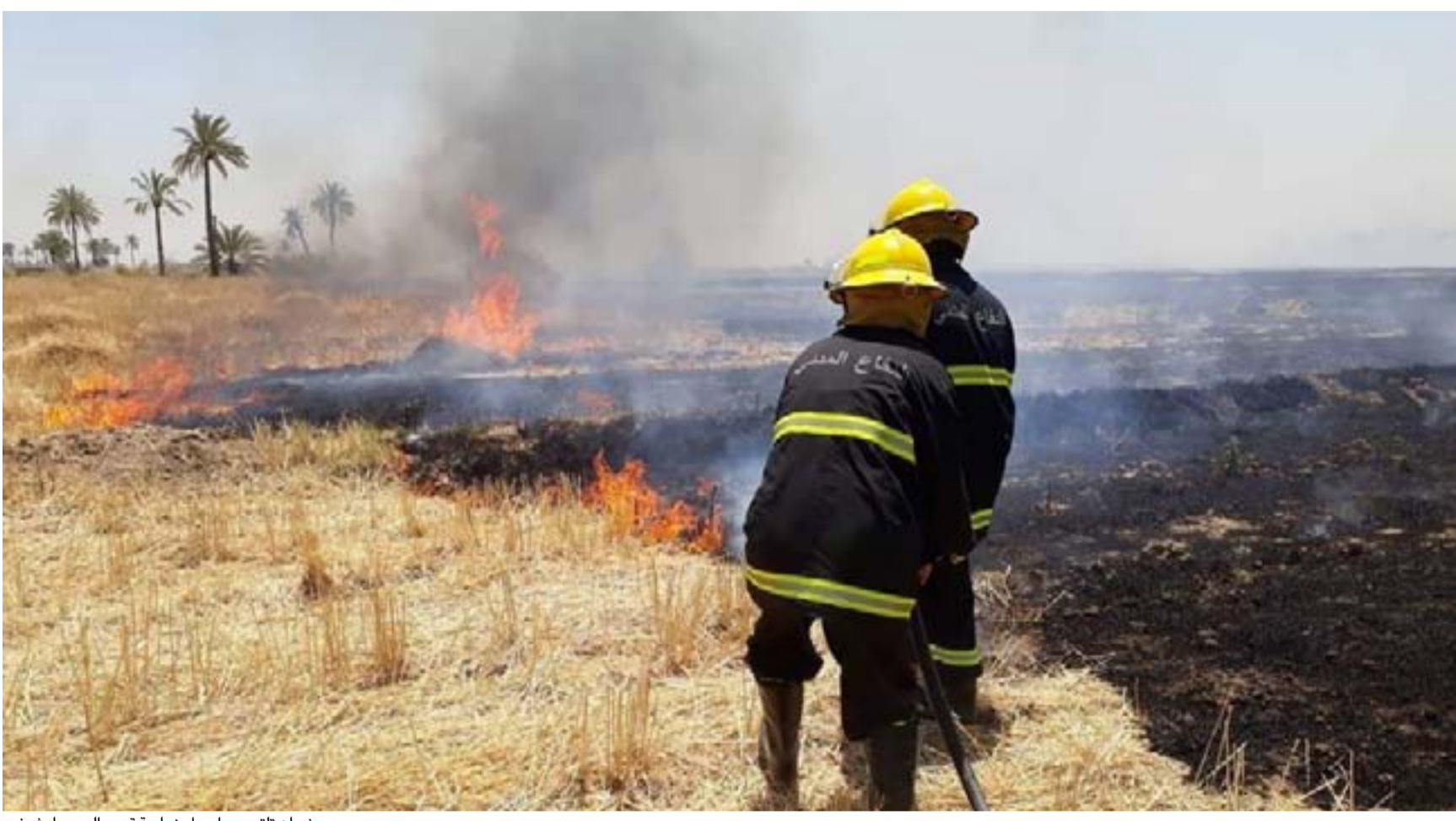
نيران تلتهم محاصيل زراعية في ديالى

يحذر مسؤولون في مدن شمال بغداد، كانت قبل 5 سنوات تحت سيطرة داعش، من "سيناريوهات خطيرة" في حال استمر منحني الهجمات التي يضدها التنظيم في التصاعد. وتشير الحوادث الاخيرة التي جرت في تلك المناطق، الى ان التنظيم يحاول إعادة الانطلاق مجدداً من ديالى والمناطق الحدودية مع ايران والسليمانية وكركوك. وفي شهر واحد نفذ التنظيم اكثر من عشر هجمات مسلحة في ديالى، عن طريق الهاونات والعبوات الناسفة والقنص، بالإضافة الى اشتباكات مباشرة مع القوات الامنية، كما عاد مسلسل حرق المحاصيل.