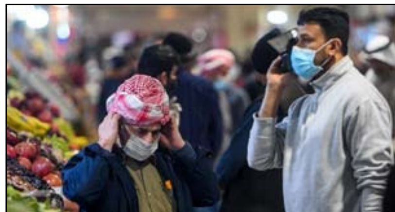
الحجاسي، أمس الأحد، تسجيل إصابات بفايروس كورونا في منطقة المنصور غربي