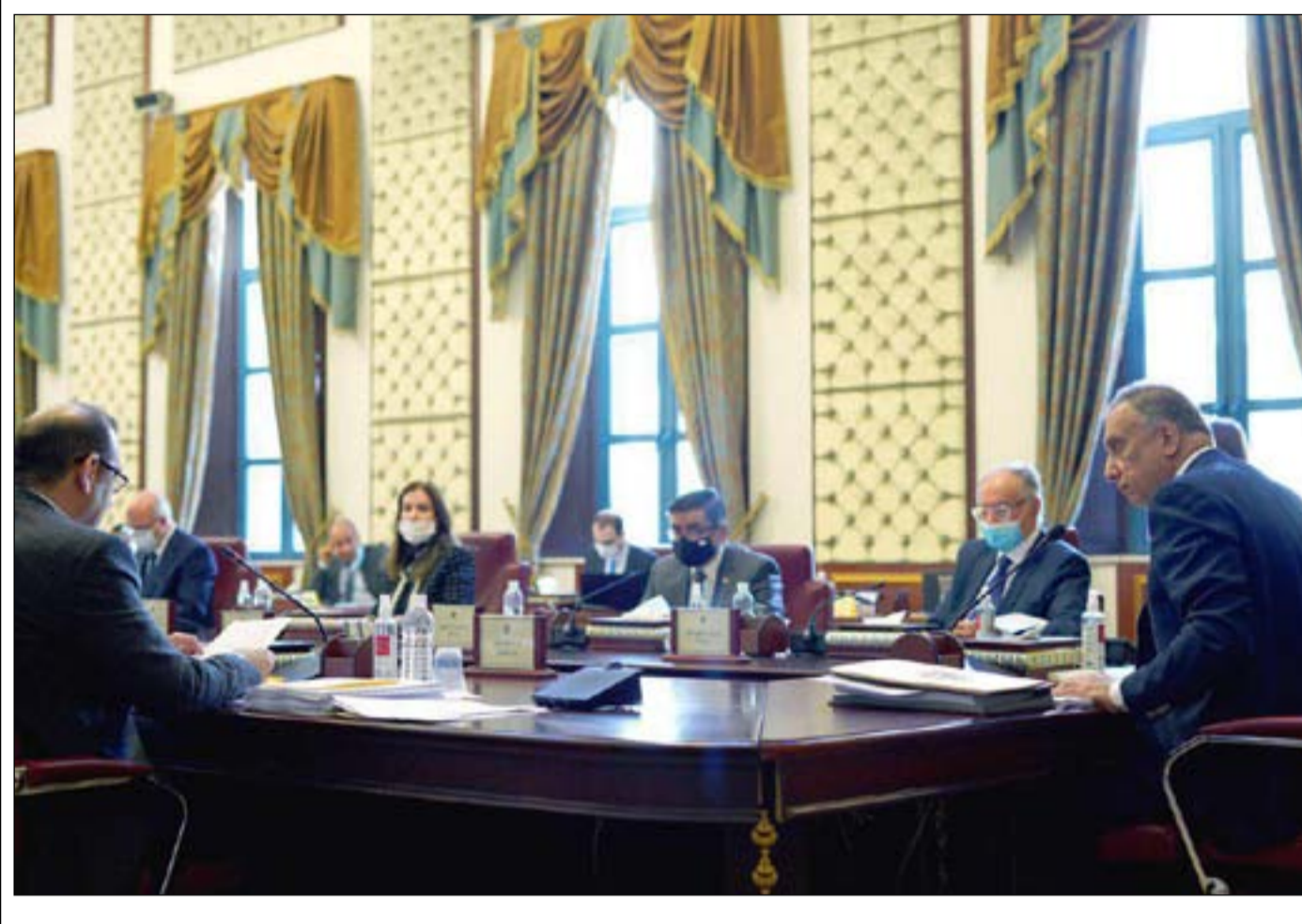
مجلس الوزراء يناقش مشروع قانون الموازنة

خبير اقتصادي: خفض قيمة الدينار ضمن برنامج وزير المالية ومقترح من البنك الدولي