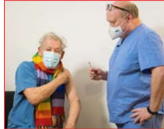
تلقية الجرعة. ونقل عن ميكيلان (٨١ عاماً) قوله في أحد منشورات هيئة الصحة الوطنية التي أعاد نشرها على

قال الممثل البريطاني، إيان ميكيلان، الذي لعب دور الساحر غاندا في سلسلة أفلام "سيد الخواتم"، إنه شعر بالبهجة بعد حصوله على الجرعة الأولى من لقاح "فايزر" المضاد لفيروس كورونا، وحث كل من يمكنه الحصول على اللقاح لفعل ذلك.