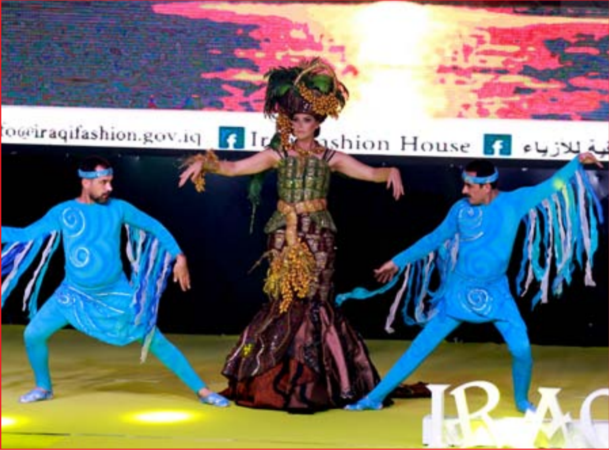
جانب من حفل ختام معرض العراق الدولي للكتاب...