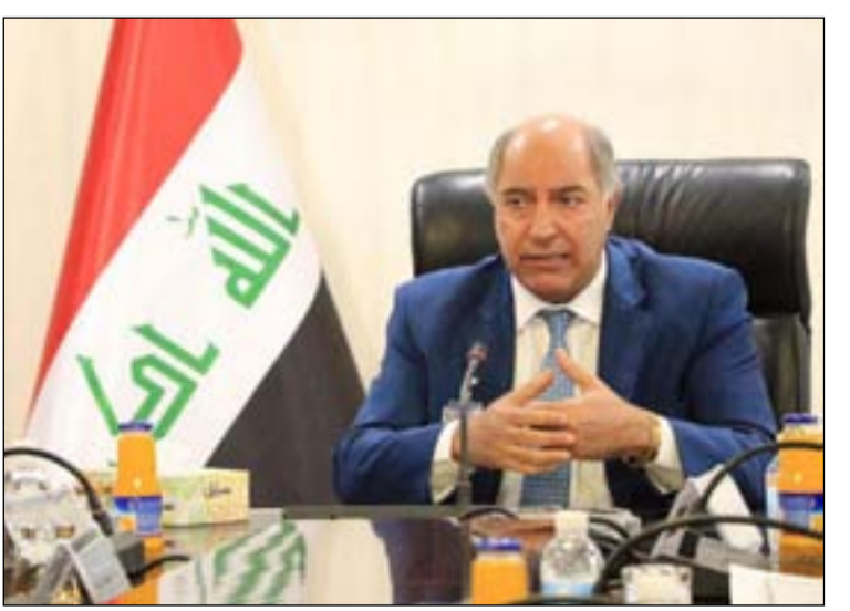
السفير العراقي في تركيا حسن الجنابي.. أ.أ.أ.أ.

شركة تركية تعمل مع شركاء عراقيين في العراق. ورأى الجنابي أن "ذلك منجزا مهما للمواطنين العراقيين، سواء كانوا من السياح أو الباحثين عن العلاج أو الدراسة أو الزيارات القصيرة لأغراض اضطرارية مختلفة إضافة إلى المستثمرين والعمال