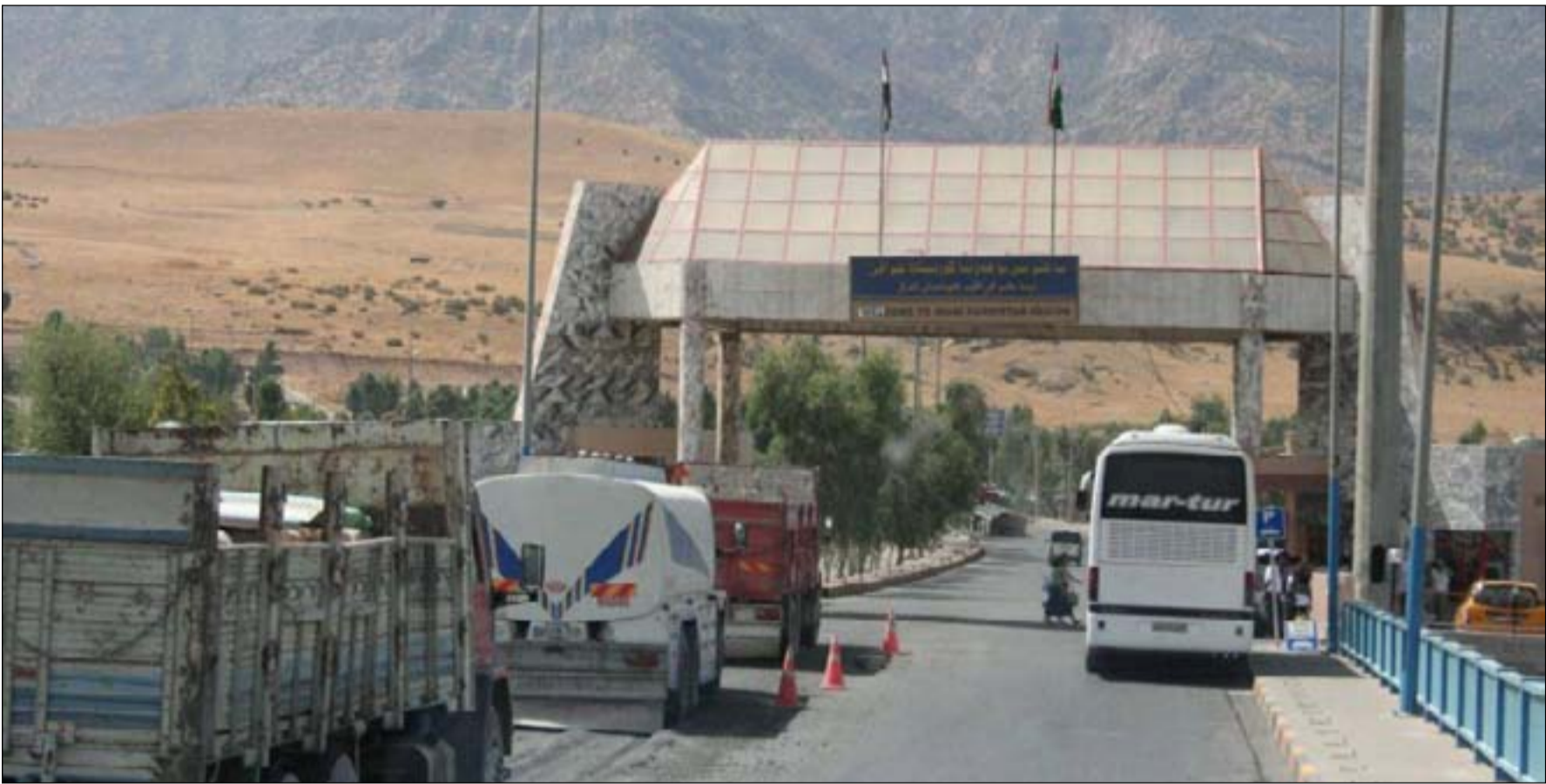
أحد المنافذ الحدودية.. أ.أ.أ.أ.

وأضافت الحكومة في بيان صدر الأربعاء الماضي بعد اجتماع المجلس الوزاري للأمن الوطني (وهو مجلس