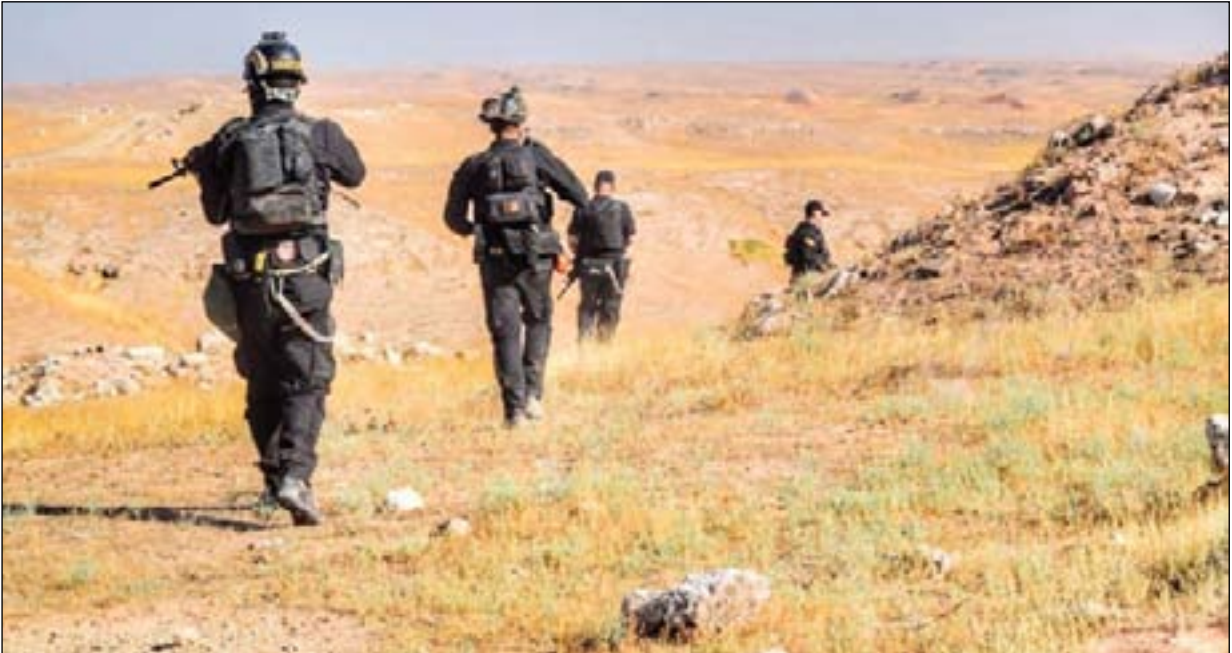
قوة عسكرية في جبال حمرين