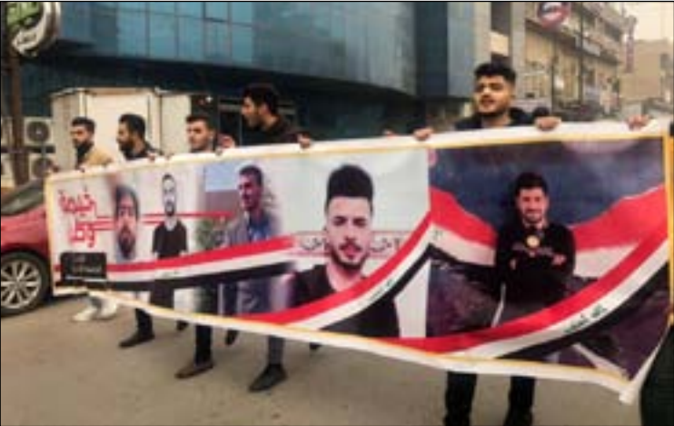
ناشطون يحملون صور الشهداء