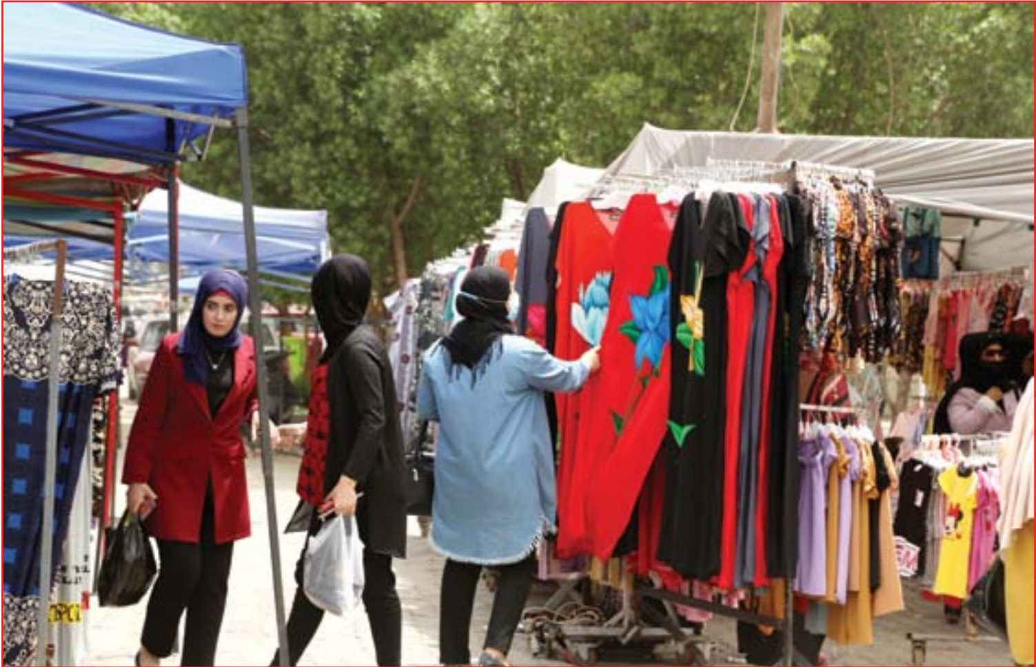
كساد كبير في الأسواق تزامنا مع العيد...

10 هادي عزيز علي: ميزانية الأوقاف الباهظة ومأمورية الزير