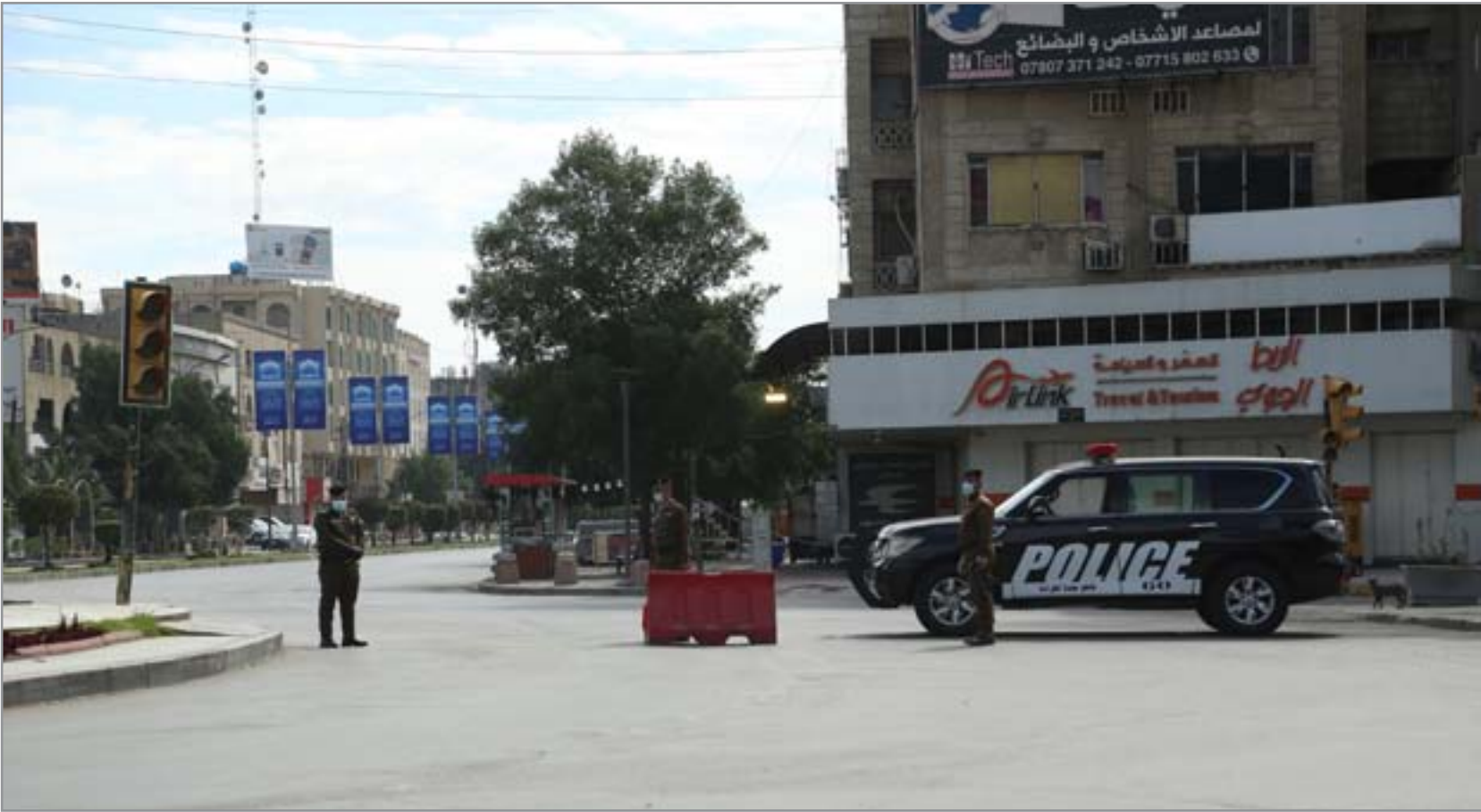
مراقبة أمنية وسط بغداد

بها"، مستدركا "لكن هذا لا يعني ان فرض الحظر الشامل سيؤدي الى الالتزام". من جهته، يقول ياسين كاظم- كاسب- إن "حظر التجوال الشامل يذهب بنا الى ازيمات اجتماعية واقتصادية". ويضيف كاظم لـ(المدى) "منذ فرض الحظر في عام 2020 ومن ثم اعاده فرضه في العام الحالي لم نر تعويضات من قبل الحكومة رغم مطالبات الطبقات الكادحة مرارا وتكرارا". ويشير الى أن "فرض الحظر لا ينتج سوى ضغط نفسي واعباء اقتصادية تثقل كاهل الفقير".