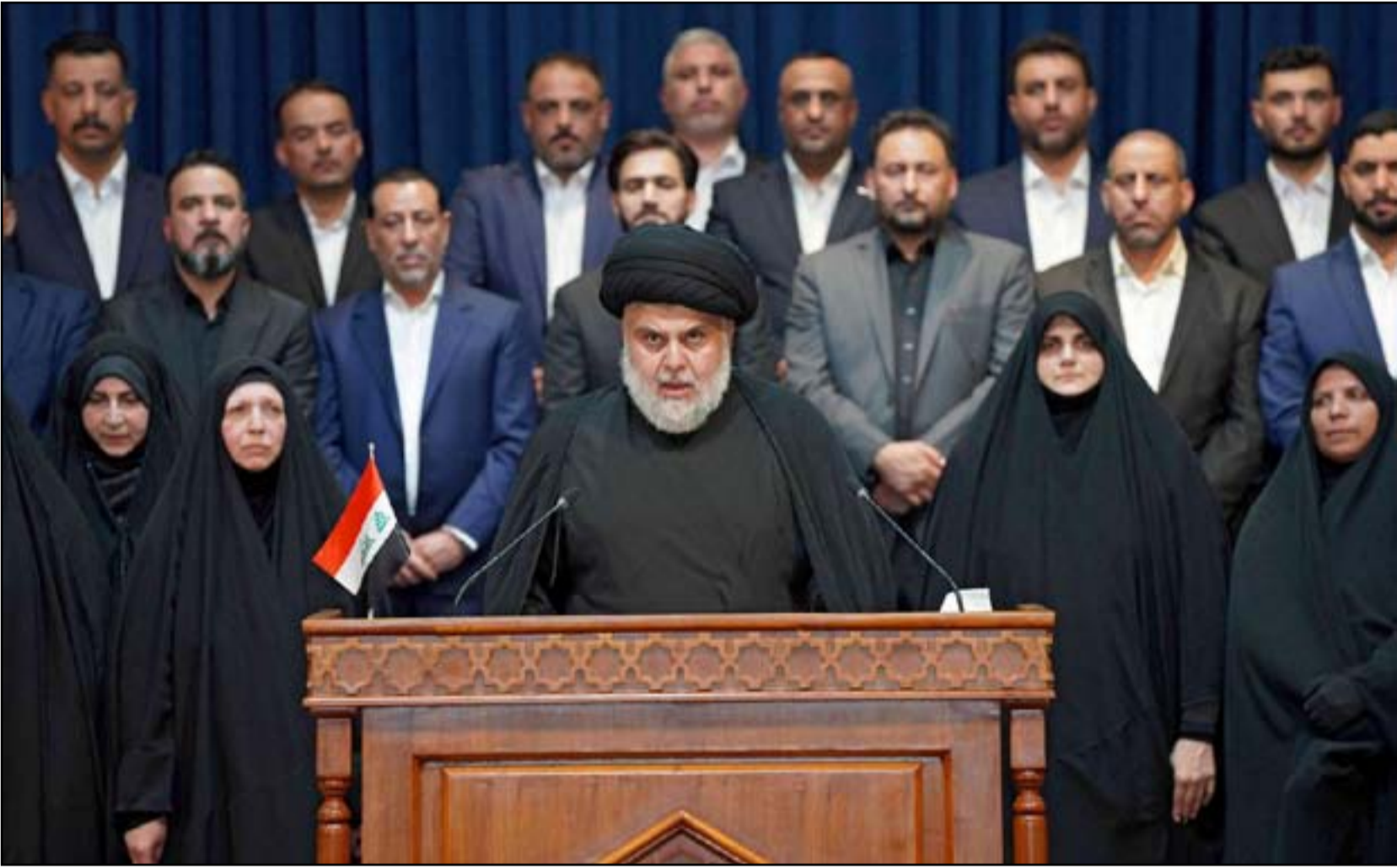
الكتلة الصدريّة.. ارشيف

وانتهى العبد ربه، إلى أن "القوى السنية الفائزة في الانتخابات لن تكون جزءاً من المعارضة، وهي تريد المشاركة في الحكومة، لكنها لن تقف مع طرف على حساب الآخر". وكان الحزب الديمقراطي الكردستاني قد أعلن بأكثر من تصريح، أكد من خلاله أنه يقف على مسافة واحدة من جميع القوى السياسية، مطالباً الكتل الشيعية بالتوافق على مرشح رئيس مجلس الوزراء.