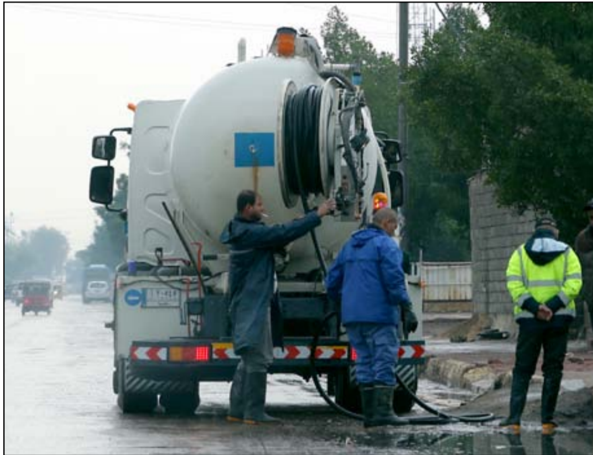
استعدادات لأمطار الشتاء...