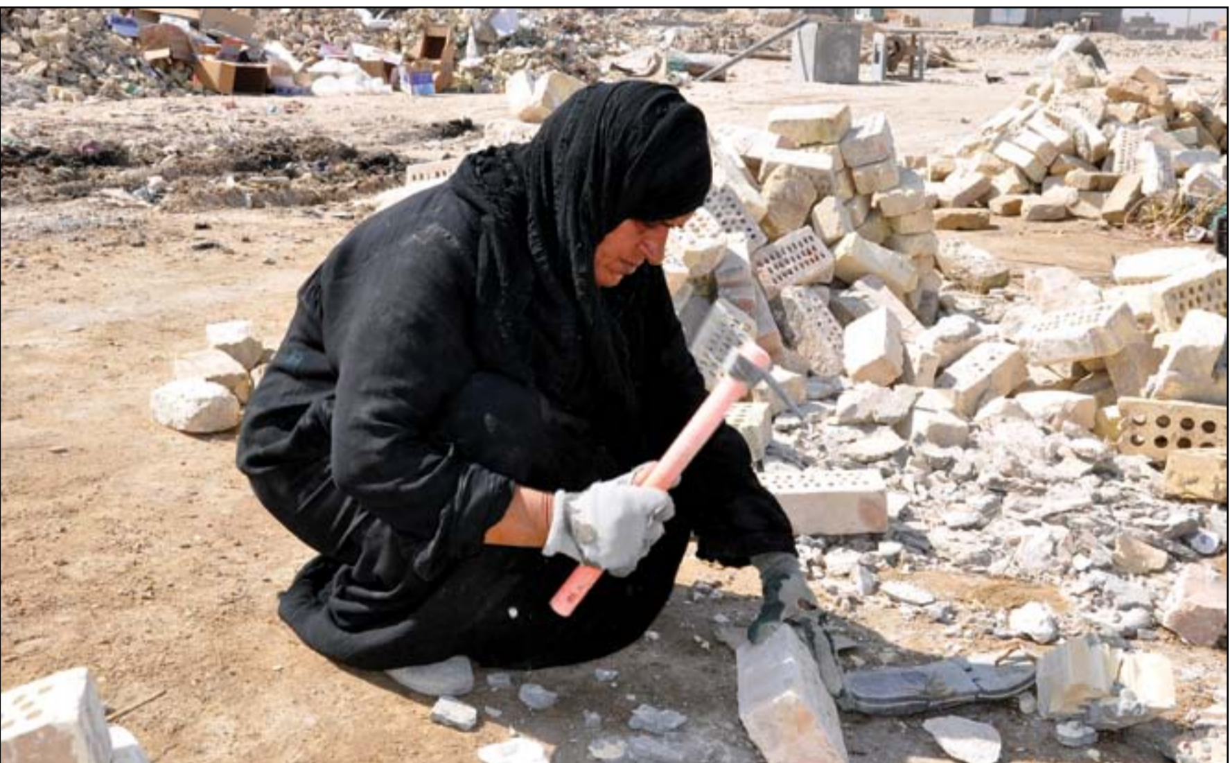
ظروف المعيشة تجبر النساء الميعلات على الانخراط في اعمال شاقة..