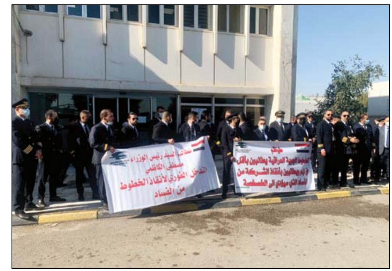
الطيارون العراقيون يدقون ناقوس الخطر: الفساد سيؤدي إلى إفلاس الخطوط الجوية العراقية!

■ خاص / المدى بعد مفاوضات مع السعودية وقطر، أرسلت وزارة الكهرباء مجددا وفودها الى الجانب الإيراني بشأن بحث ملف تصدير الغاز والديون المترتبة على العراق. وطمأنت الوزارة، بأن اخر زيارة للوفد الى إيران اعلن فيها استعداد طهران لزيادة حجم الغاز عما هو عليه حاليا، مبينة أن العقوبات المفروضة على الجانب الإيراني هي من آخرت سداد الديون. ويعتمد العراق بشكل كبير على واردات الغاز لتغذية شبكة الكهرباء، إذ تولد البلاد نحو 14 ألف ميغاواط من الشركة المحلية، إلى جانب ما يقارب من 4 آلاف ميغاواط عن طريق استيراد الغاز من إيران. ■ التفاصيل ص 2