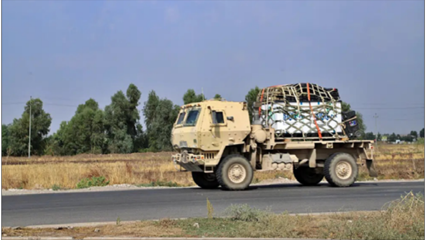
عجلة تابعة لقوات التحالف الدولي

بقيت في البلاد ولكن على نحو ثابت لضمان علاقة مستمرة مع شريك رئيسي في منطقة الشرق الاوسط على المستوى العسكري والدبلوماسي.