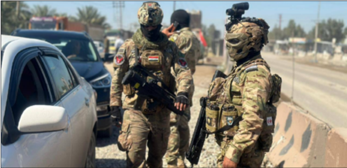
انتشار أمني مكثف في ديالى