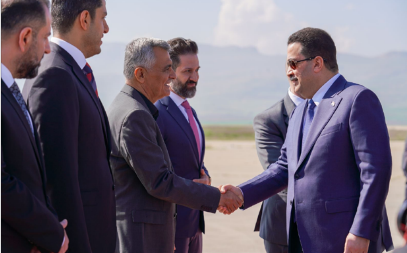
زيارة السوداني إلى السليمانية أمس