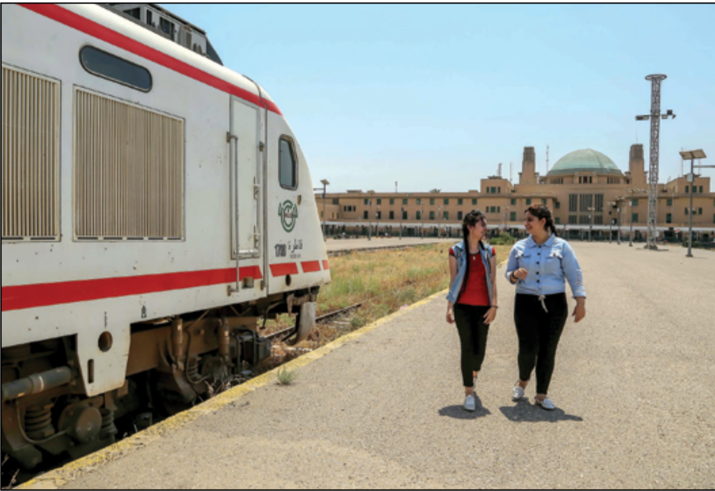
المحطة العالمية وسط بغداد...