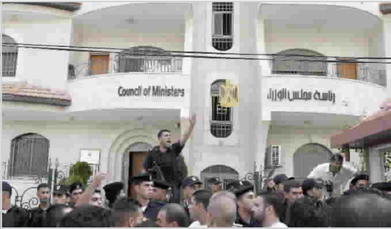
إضراب امام رئاسة مجلس الوزراء الفلسطيني