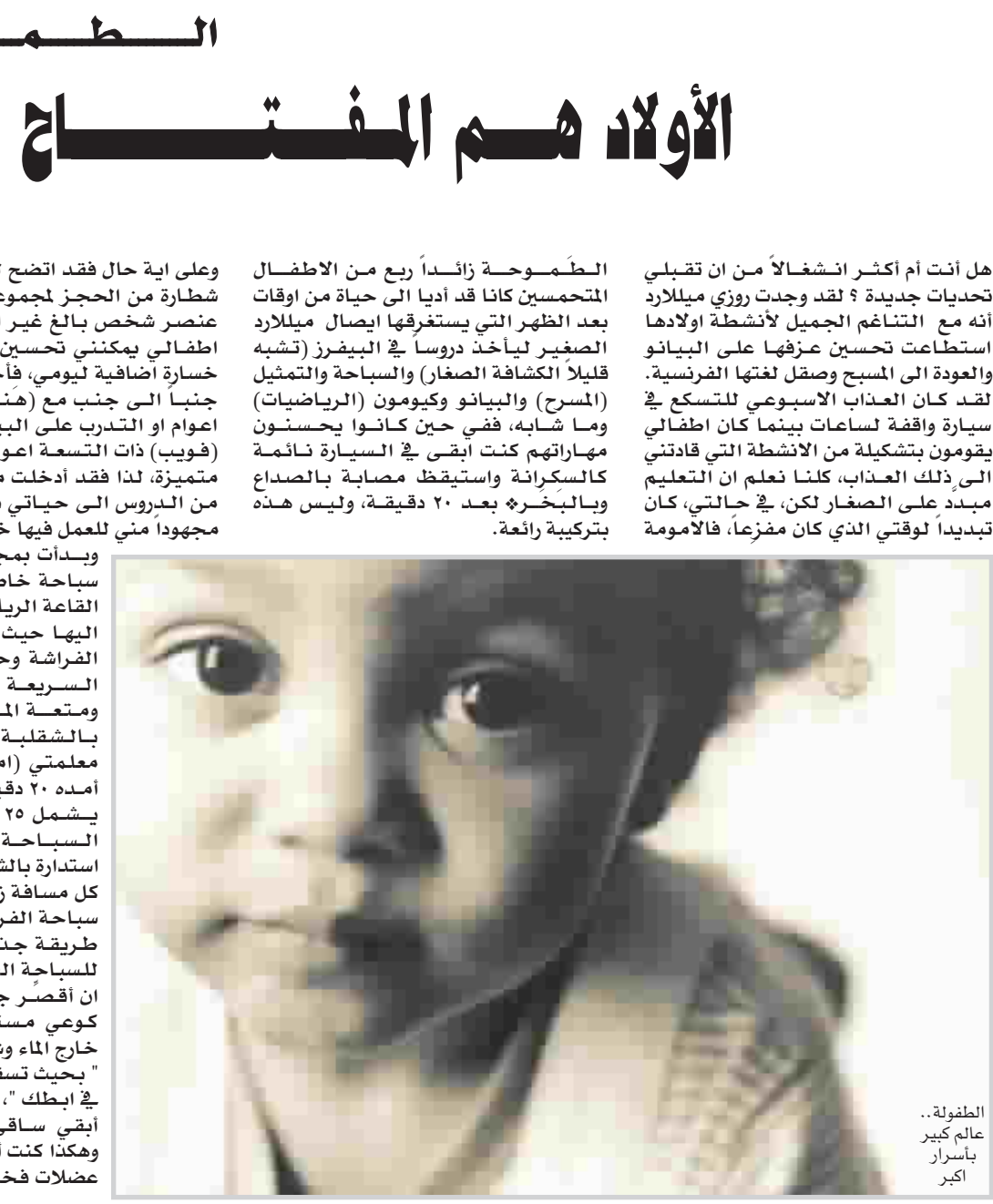
الطفولة.. عالم كبير أكبر