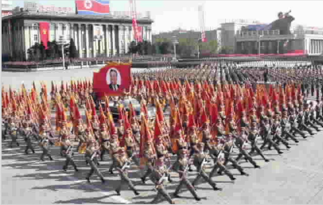
استعراض للجيش الكوري الشمالي

وازاء هذه التصريحات أعلن سفير كوريا الشمالية في الامم المتحدة ان على الاسرة الدولية تهنة بيونغ يانغ على اول تجربة نووية لها بدلا من ادانتها. وقال باك جيل يون لشبكة "سي ان ان" الاميركية "من الافضل ان يهنئ مجلس الامن الدولي العلماء والباحثين في كوريا الشمالية بدلا من الضي في صياغة قرار طائش" ضد بيونغ يانغ.