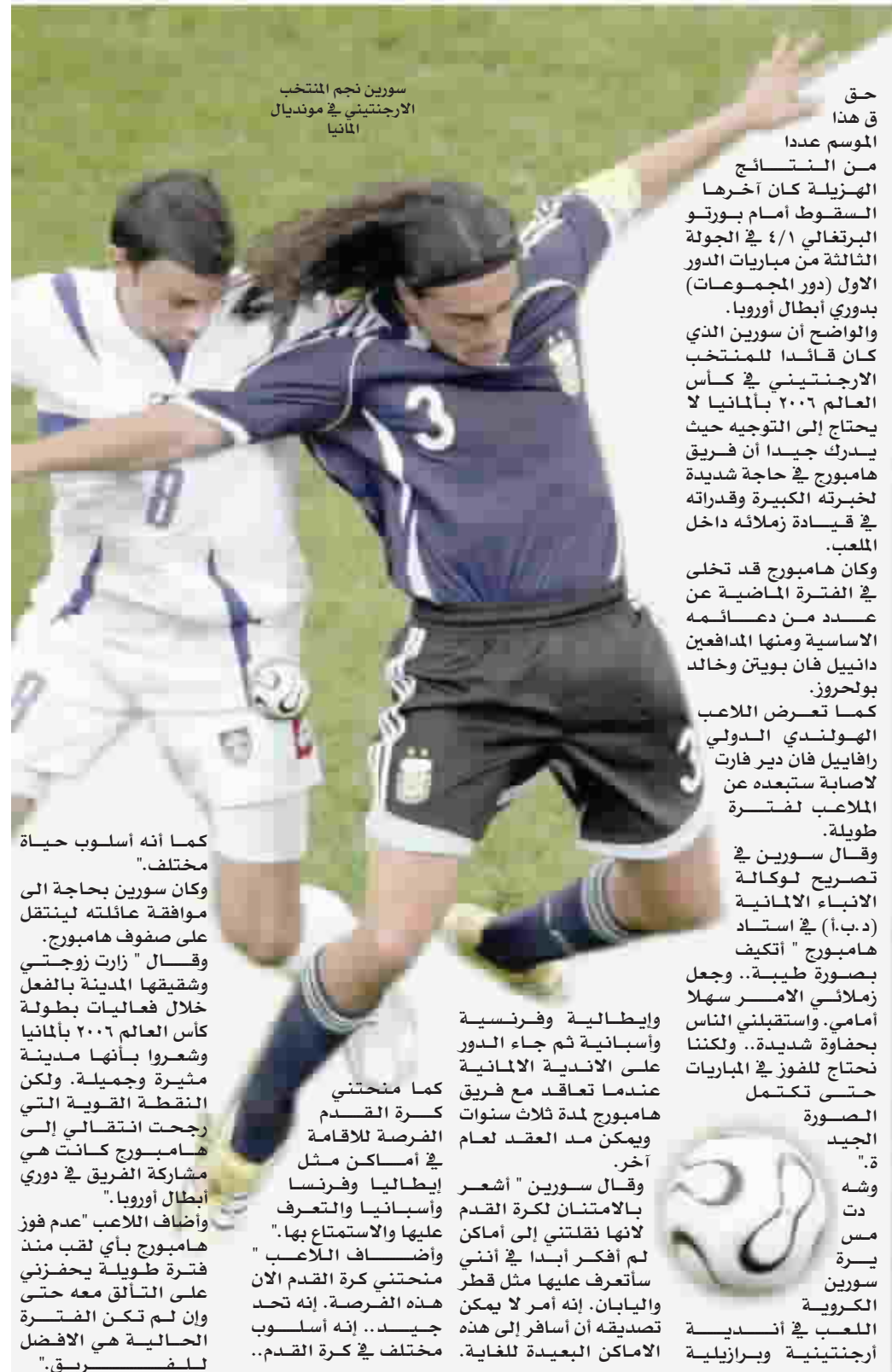
سورين نجم المنتخب الارجنتيني في مونديال ألمانيا

كما أنه أسلوب حياة مختلف. وكان سورين بحاجة الى موافقة عائلته لينتقل على صفوف هامبورج. وقال " زارت زوجتي وشقيقها المدينة بالفعل خلال فعاليات بطولة كأس العالم 2006 بألمانيا وشعروا بانها مدينة مثيرة وجميلة. ولكن النقطة القوية التي رجحت انتقالي إلى هامبورج كانت هي مشاركة الفريق في دوري ابطال أوروبا. " وأضاف اللاعب " عدم فوز هامبورج بأي لقب منذ فترة طويلة يحفزني على التألق معه حتى وإن لم تكن الفترة الحالية هي الأفضل لفريقي".