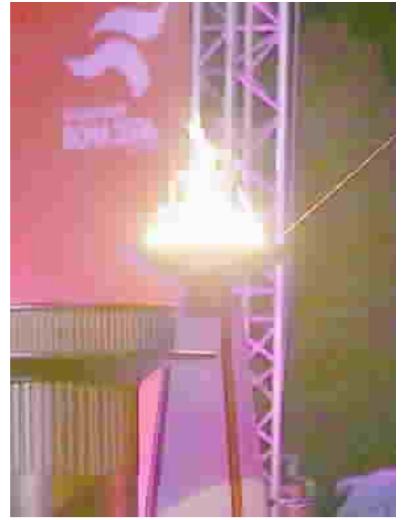
شعلة الدورة الآسيوية

عرب نائب المدير العام للإداري في اللجنة المنظمة لدورة الألعاب الآسيوية الخاصة عشرة التجهيزات تستضيفها قطر من أقاليمها كاتون الأول المقبل عن ارتياح اللجنة الكبرى الحا الجاهزية في جميع النواحي التنظيمية قبل نحو عشرين يوماً من انطلاق الألعاب رسمياً.