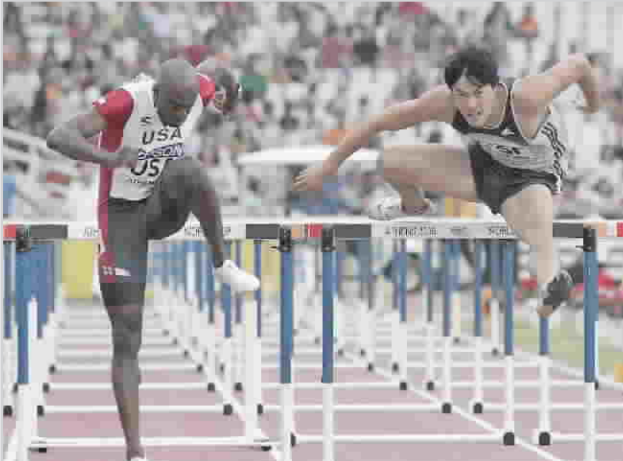
حسب الشوانسي ستشهد مفاجآت مثيرة في الاسياد

لندن ومدريد / أ ف ب واوضح "هدفنا كان باستفادة الدولة في استعمال جميع المنشآت بعد الألعاب، ولذلك اعتبرنا الصالة الخاصة في المطار مؤقتة"، مضيفاً "تنظيمياً سعينا الى ان لا نترك للدولة منشآت غير قابلة للاستخدام ولذلك هناك الكثير من المنفعة الاقتصادية في المستقبل وتجري ابحاث حالياً حول القيمة المضافة لقطر من جراء ذلك، فالمرود سيكون غير مباشر عبر برامج ومشاريع تساهي قيمتها كثيراً ويمكن ان يستمر الى عشرات السنين". وختم قائلاً "قلنا منذ البداية ان هذه الدورة ستكون لقاء العمر، وخططنا لعملنا بجهد في اللجنة ونأمل في ان تكون ان لم تكن الافضل، واحدة من الافضل".