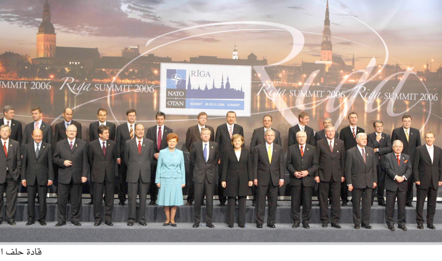
قادة حلف الناتو

بدأ قادة الدول الست والعشرين الأعضاء في حلف شمال الأطلسي أمس الأربعاء في ريغا جلسة موسعة وحيدة سبقها حفل تكريم لجنود الحلف الذين قتلوا في مسرح العمليات. وستكسر الجلسة الموسعة خصوصاً التحول السياسي والعسكري للحلف واحتمال توسيعه في منطقة البلقان.