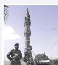
شاهين 1 كيلومترا

أجرت باكستان أمس الأربعاء، تجربة ناجحة على نسخة جديدة من صاروخ قادر على حمل رؤوس نووية، وفق ما أكد مسؤولون عسكريون باكستانيون. وجاء في بيان صادر عن قيادة الجيش الباكستاني أن الصاروخ الباليستي المتوسط المدى من طراز شاهين 1 يبلغ مداه 700 كيلومترا.