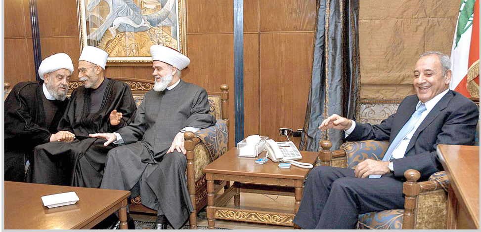
جهد متواصلة لواد الفتنة الداخلية في لبنان

وأضاف "بمنطق العصيان تكون قد ادخلنا البلد في مشكلات لا قبل بها على الصعيد الأمني والسياسي والاقتصادي وخرجنا من نطاق الشرعية العربية والدولية وجعلنا لبنان ساحة للصراع الاقليمي. وهذا منطق ياخذنا الى الانتحار بينما المنطق الذي نسير نحن به هو منطق الحوار والانفتاح والجلوس سوية لمعالجة كل شيء". وعن موضوع الفتنة الشعبية السنية، قال السنيرة "وجودي