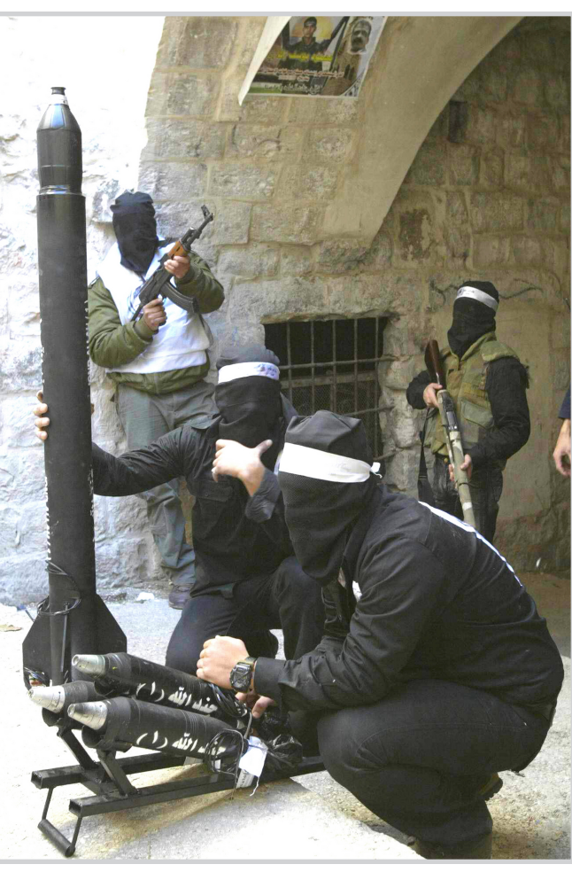
عناصر من الكتائب الفلسطينية المسلحة تصب قاعدة للصواريخ

وقال أولمرت "يجب أن أعترف باننا نشعر بشيء من خيبة الامل بسبب استمرار إطلاق النيران". وأضاف "كلي أمل ان يفي الفلسطينيون بالتزاماتهم حتى يستمر وقف إطلاق النار. نحن نعمل كي يسود الهدوء". وقال ان إسرائيل "ستستمر في التحلي بضبط النفس لكن على الفلسطينيين في الوقت ذاته