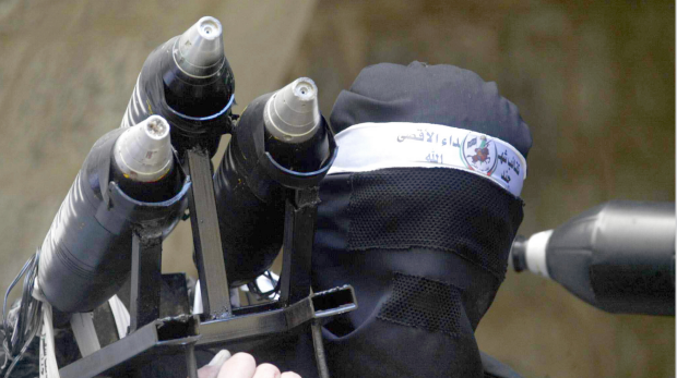
عنصر في كتاب شهداء الأقصى يحمل قاعدة للصواريخ

وعلى صلة بالموضوع قال دبلوماسيون في الأمم المتحدة ان الجمعية العامة ستعقد جلسة خاصة الأسبوع القادم للموافقة على خطط لإنشاء سجل لدعوى التعويضات عن الأضرار الناشئة عن بناء إسرائيل جدارها العازل في الضفة الغربية. وجاء طلب عقد الجلسة الخاصة في الخامس من ديسمبر كانون الأول من دول عربية بعد ان قال الأمين العام كوفي عنان انه مستعد لإنشاء السجل ودعا الجمعية المكونة من 192 عضوا الى الموافقة على مقترحاته. ودعت الجمعية لأول مرة الى إنشاء السجل في قرار صدر في آب عام 2004 طلب من إسرائيل تنفيذ حكم للمحكمة الدولية بهدم الجدار.