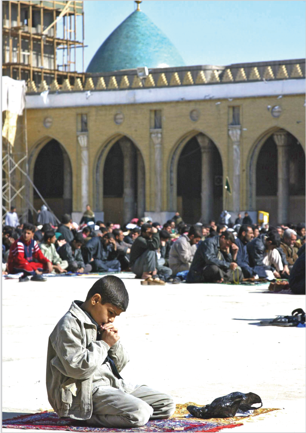
صلاة منفردة في باحة مسجد الكوفة

"يقيم بجديّة" التقرير، إلا أنه بدأ وكأنه يستبعد بعض التوصيات مثل فتح حوار غير مشروع مع إيران وسورية. كما استبعد أيضاً تقليص الدور القتالي للقوات الأمريكية في العراق.