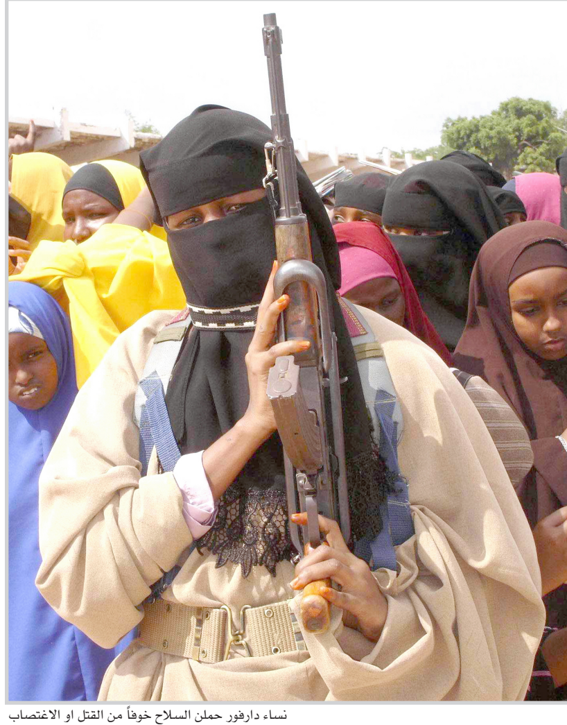
نساء دارفور حملن السلاح خوفا من القتل او الاغتصاب

قال مصدر في الرياض "اشك في ذلك". وقال ستيفن كليموونز خبير السياسة الخارجية في معهد "نيو اميركا فاونديشن" استنادا الى مصادر سعودية ان الامير تركي سئم بكل بساطة المؤامرات التي يحكيها بعض خصومه في الحكومة الذين لا يؤيدون اجراء اصلاحات. وقال كليموونز ان "رحيله سلبى للغاية بالنسبة لنا"، موضحا ان النفوذ الكبير الذي يتمتع به الامير تركي في الشرق الاقصى كان يمكن ان يساعد على ايجاد حلول للمعضلة التي تواجهها السعودية في الشرق الاقصى ولا سيما في العراق. وكان السفير البالغ من العمر ٦١ عاما ابدي تقاعدته بان على واشنطن التحاور مع ايران وبذل جهود لتحريك عملية السلام بين اسرائيل والفلسطينيين طبقا لتوصيات تقرير مجموعة الدراسات حول العراق برئاسة السفير الاميركي السابق جيمس بيكر والسناتور السابق لي هاملتون.