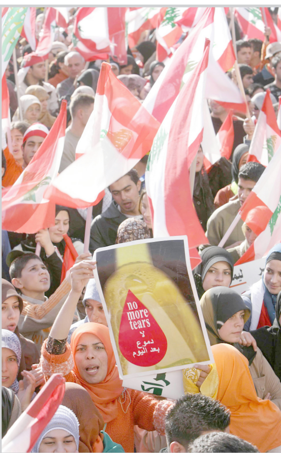
استمرار الاعتصام والتظاهرات في لبنان

أكد كبير المفاوضين الايرانيين في الملف النووي الايرواني الثلاثاء ان القرار الدولي الجاري البحث فيه في مجلس الامن لن يكون له اي تأثير على البرنامج النووي الايرواني، على ما افاد التلفزيون الحكومي. وقال لاريجاني ان "تبنى قرار (دولي) لن يوقف الانشطة النووية الايرانية" مضيفا ان الانشطة المرتبطة بالبحث ستنتهي قريبا. ان العقوبات المقررة في القرار لن يكون لها اي تأثير على برنامجنا". كما جدد التاكيد على ان بلاده ستعيد النظر في تعاونها مع الوكالة الدولية للطاقة الذرية في حال تم فرض عقوبات. واوضح "نحن لا نريد الخروج عن معاهدة منع الانتشار النووي لكن في حال تواصلت الاعمال العادي الى اسماعيل الدولية للطاقة الذرية".