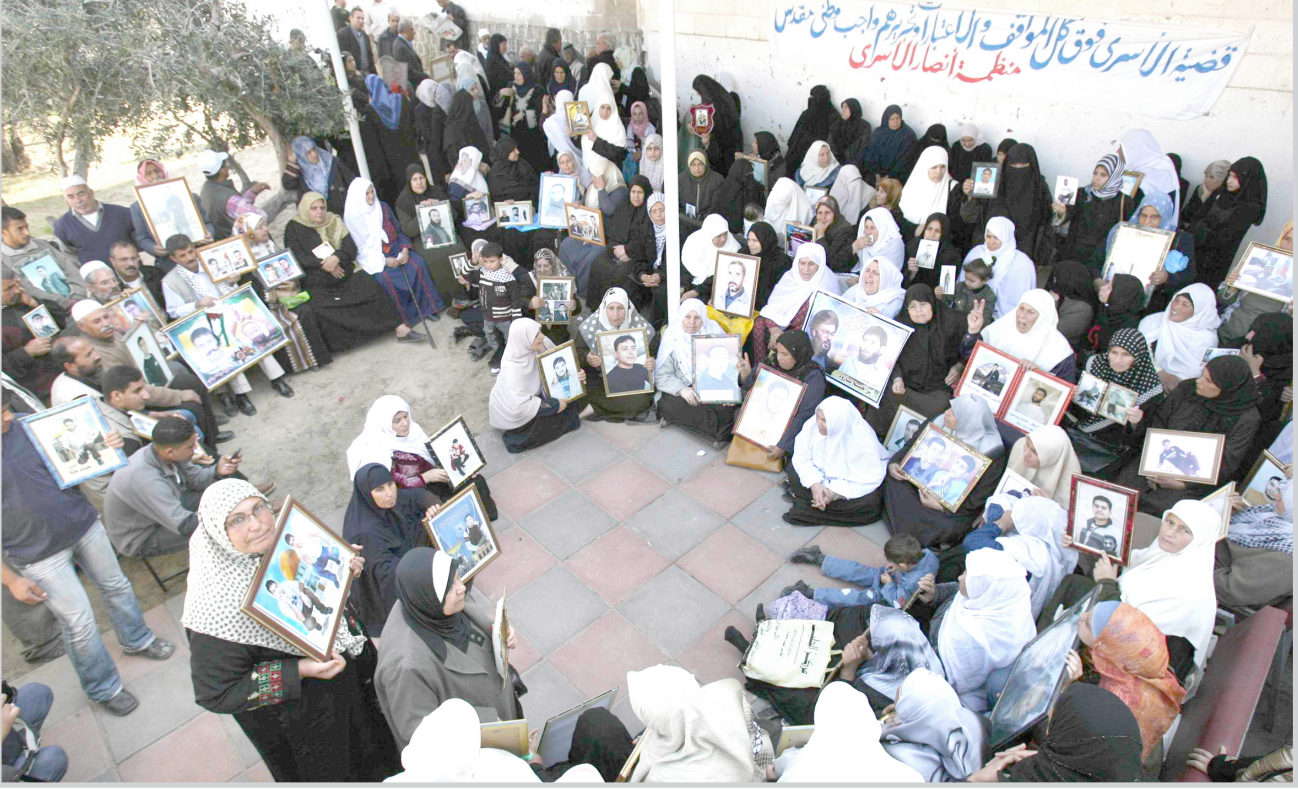
تظاهرة لفلسطينيات أمهات بطالين باطلاق سراح ابنائهن المعتقلين في السجون الاسرائيلية

من جهته، اكد نائب السفير الاسرائيلي دانيال كارامون ان "مفاوضات مباشرة (...) هي الطريق الوحيد لتحقيق تقدم". وقال ان "الاسرائيليين واللبنانيين والفلسطينيين جميعهم يستحقون ما هو افضل (...) علينا ان نتزامن لمكافحة التطرف والتشدد والتحريض والتعصب والارهاب والكراهية".