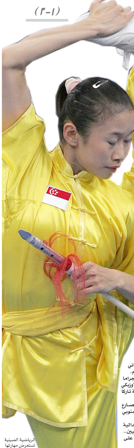
الرياضية الصينية تستعرض مهارتها

وهذا النصر الذي يعد نصرا لجميع الإيرانيين.. وأتوجه بالشكر لوالدي وللمدربين الإيرانيين على اهتمامهم بي".