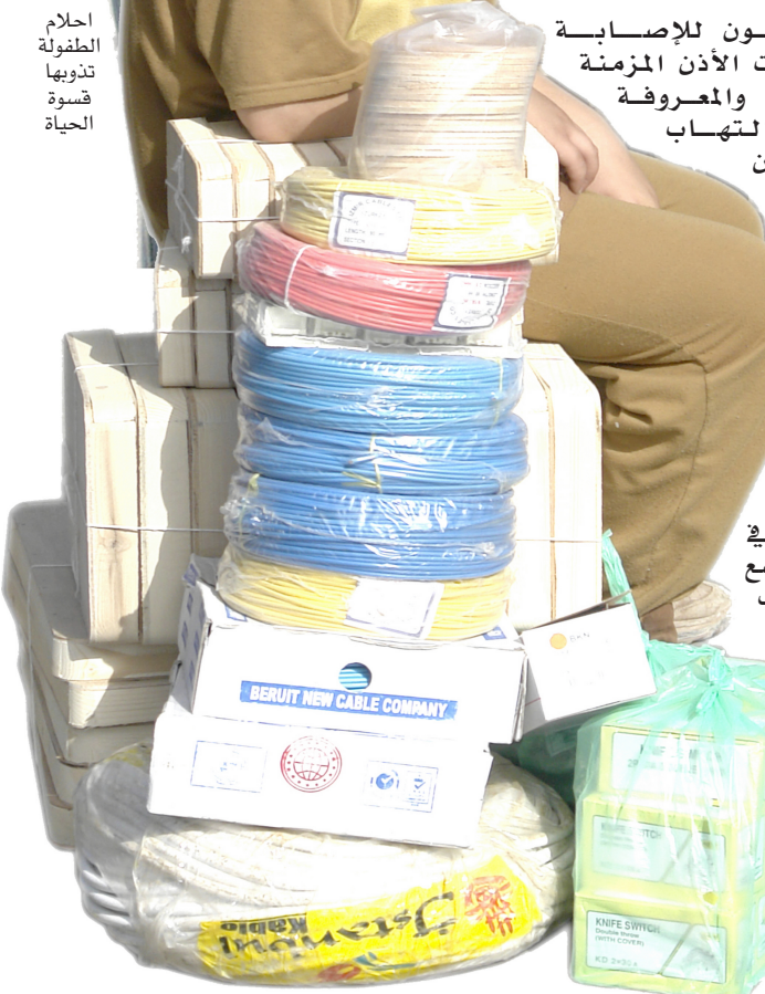
احلام الطفولة تدورها قسوة الحياة

على مدى عقود في أماكن كثيرة". وصنف موسم اعاصير المحيط الاطلسي في عام ٢٠٠٦ بأنه قريب من المعتاد اذ شهد تسع عواصف مسجلة ثاني أقل عدد للعواصف منذ عام ١٩٩٥، ويعزى تراجع نشاط العواصف غالبا لظاهرة النينو التي تقلل نشاط العواصف الاطلسي. ولم تضرب أي من العواصف الولايات المتحدة مما جعل سكان فلوريدا وساحل الخليج الذين صدموا عامي ٢٠٠٤ و ٢٠٠٥ يتنفسون الصعداء. وقد بدأت الادارة القومية الامريكية للمحيطات والغلاف الجوي الاحتفاظ بسجلات المناخ من عام ١٨٩٥.