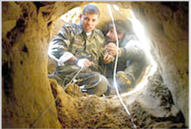
النفق الذي عثر عليه

سيعقد خلال الثلاثة أو الأربعة أسابيع القادمة.