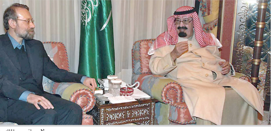
لاريجاني مع الملك عبد الله

على الطرف الآخر أكد الأمين العام لمجلس الأمن القومي الإيراني علي لاريجاني أمس الثلاثاء انه تحدث مع المسؤولين السعوديين لتحسين العلاقات بين الشيعة السنة والوضع الأمني في منطقة الشرق الأوسط، بحسب التلفزيون الرسمي. وقال لاريجاني انه بحث مع نظيره السعودي الأمير بندر بن سلطان في سبل "ارساء مزيد من الأمن في المنطقة"، بما ان ايران والسعودية "دولتان نافذتان" في المنطقة. من جهته، قال وزير الدفاع الأميركي روبرت غيتس إن الأنشطة العسكرية الأمريكية في الخليج العربي تهدف إلى