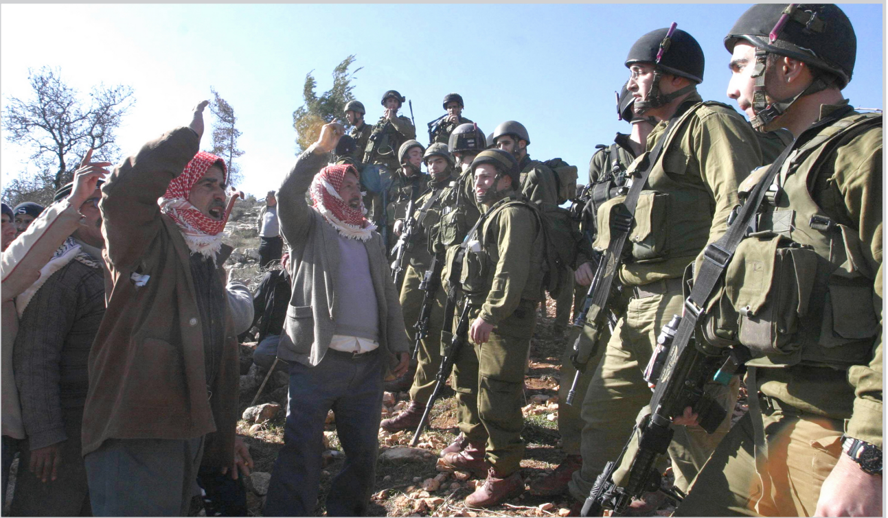
فلسطينيون يصرخون بوجه جنود الجيش الاسرائيلي

الوطنية قال هنية إنه حدثت "بداية مشجعة" للجهود الرامية إلى تشكيل حكومة وحدة وطنية مع حركة فتح المناهضة. وأضاف قائلاً "كلّي أمل أن ترى حكومة الوحدة الوطنية النور في أقرب وقت ممكن إذا خلصت النوايا". فيما جدد هنية رفضه دعوة عباس التي انتخبات مبكرة. وقال أن حماس لن توافق مطلقاً على الشروط التي حددتها الدول الغربية والتي تشمل أيضاً قبول اتفاقات السلام التي وقعها منظمة التحرير الفلسطينية وإسرائيل في عقد التسعينات.