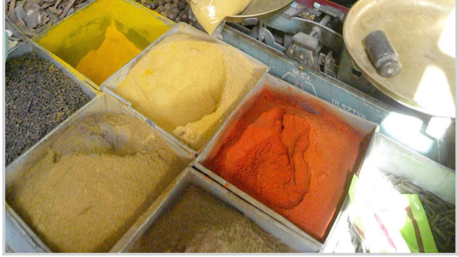
بائعات توابل في سوق الشورجة

بغداد / بغداد تواصل الدوائر البلدية التابعة لأمانة بغداد تنفيذ خططها الأسبوعية برفع التجاوزات عن الشوارع والأرصفة والأراضي التابعة للأمانة بالتعاون والتنسيق مع القوات الأمنية المنفذة لخطة فرض القانون ونقل بيان للمكتب الإعلامي لأمانة بغداد تسلمت لدى نسخة منه امس عن النشاطات التي قامت بها الدوائر البلدية في مجال رفع التجاوزات خلال الأسبوع الحالي والتي تضمنت قيام دائرة بلدية الأعظمية بإزالة التجاوزات الحاصلة على كراج غسل وتشحيم العامري ومعامل الكاشي الواقعة في حي القاهرة حيث تم غلق جميع المحال المتجاوزة على أملاك الأمانة . وأضاف البيان ان بلدية الرصافة قامت من جانبها بحملة لرفع التجاوزات الحاصلة على عدد من المساكن الواقعة في أكاف القناة . فيما قامت دائرة بلدية (٩ نيسان) بحملة لرفع التجاوزات الحاصلة في منطقة (زينة -الشارع الرئيس) ومنها معارض للأثاث متجاوزة على الأرصفة وأكشاك وبسطات . أما بلدية الرشيد فقد قامت بإزالة التجاوزات من موقع المخلفات الصلبة في البيع وإزالة تجاوز كراج غسل وتشحيم للسيارات عدد (٣) في حي الرسالة . وأشار البيان الى قيام دائرة بلدية الشعلة بإزالة وغلق كراج لبيع المواد الاحتياطية (التفصيح) في منطقة (جكوك) وإنذار صاحب معمل البركة لبيع الزيت في منطقة (الديخانة) وغلق معمل لبيع وإنتاج (الشايكر) في المنطقة ذاتها فضلاً عن غلق المحال المتجاوزة في سوق الشعلة الثانية . وأخيراً قامت بلدية الكرخ بغلق مطعم الفصول الأربعة لتجاوز على الشارع العام وإنذار صاحب عيادة الرنين في شارع الكندي برفع القودرة وتنظيف المخلفات التي طردتها العبادة وإزالة التجاوزات الحاصلة على أرصفة شارع الكندي الرئيس من قبل أصحاب البسطات والباعة المتجولين .