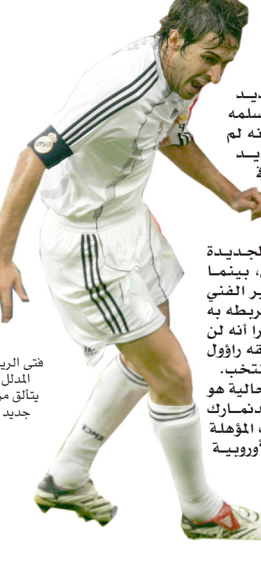
فتى الريال الملل يتالق من جديد

المدير الرياضي الجديد بالاتحاد الإسباني أثناء تسلمه مهام منصبه الجديد ، إنه لم يبحث عن مدرب جديد للمنتخب ولن يتدخل في عمل المدير الفني الحالي لويس لوياس أراجونيس وأوضح إييرو أن "مهته الجديدة رياضية في المقام الأول، بينما يتولى المهمة الفنية المدير الفني لويس أراجونيس الذي تربطه به علاقة صداقة ودية"، مشيراً أنه لن يتدخل في عودة صديقه زاوول جونزاليس إلى صفوف المنتخب. وأكد ان المهة في الفترة الحالية هو التركيز في مباراة الدنمارك القادمة ضمن التصفيات المؤهلة لنهائيات كأس لام الأوروبية وسويسرا .