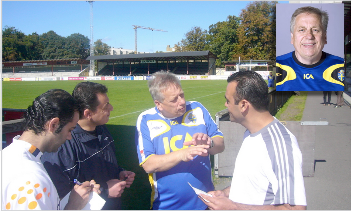
النعميمي في حوار مع المدرب السويدي

الخطط التكتيكية المناسبة فإضافة الى هذا العامل انك تشتركون بخصائص لعب ومناخ مشترك بمعنى ان فرق آسيا تعرف بعضها البعض وهنا تلعب عوامل نفسية وتاريخية وقد تلقى بظلالها على سير المباراة والاحداث وربما ان اللاعب العراقي تنشق على نفسه ووظف مجموعة من العوامل الحرة التي اذلت العالم بشكل بهذه الصورة المشرفة والحق العالم بشكل ساحر. واجزم انكم الان على مشارف العالمية ان تمكنتم في تجاوز ظروف استعداداتكم المتواضعة ويصراحة لديكم لاعبين من طراز نادر ويصلحون للعب في اوروبا. مخلو عرض عليك تدريب المنتخب العراقي هل ستوافق؟ - بحكم خبرتي الكثيرة سأختار لك جوابا بدبلوماسيا ..نعم اوافق ولكن مرتبط مع