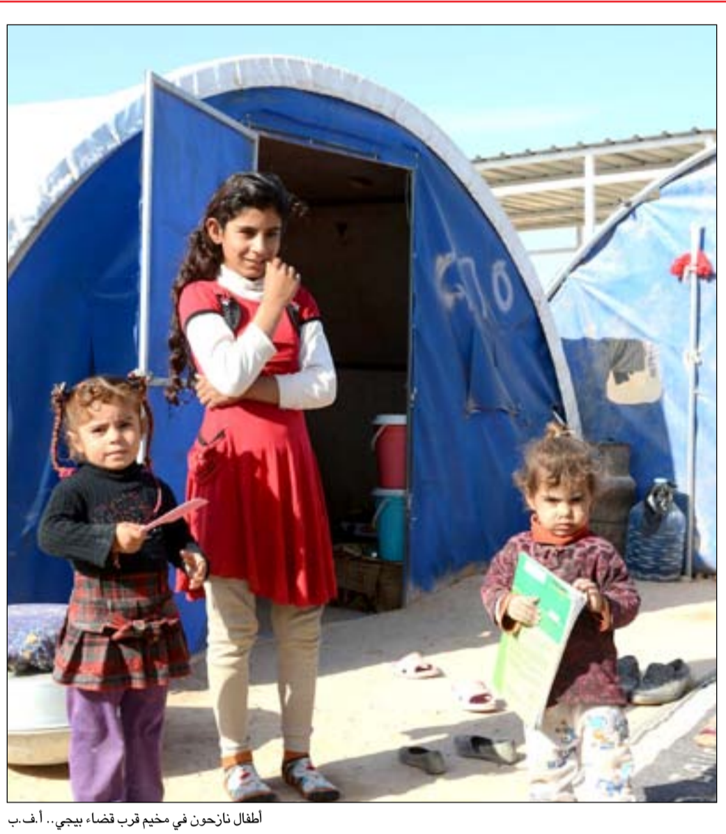
أطفال نازحون في مخيم قرب قضاء بيجي..