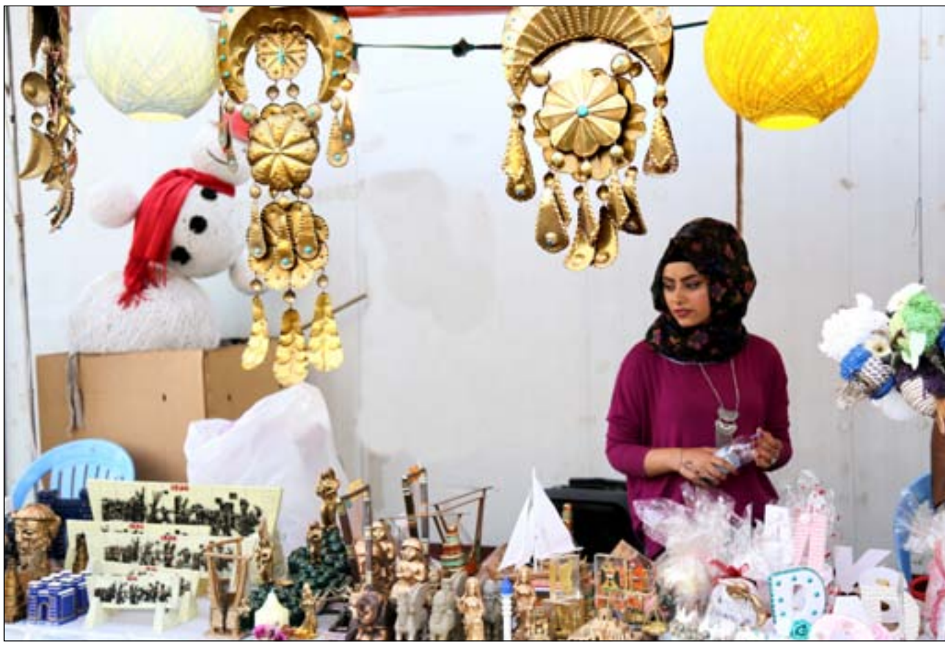
بازار للأعمال اليدوية في شارع المنتبى

7-6 الأسود يتربصون بالبحرين أملًا في فوز ثمين