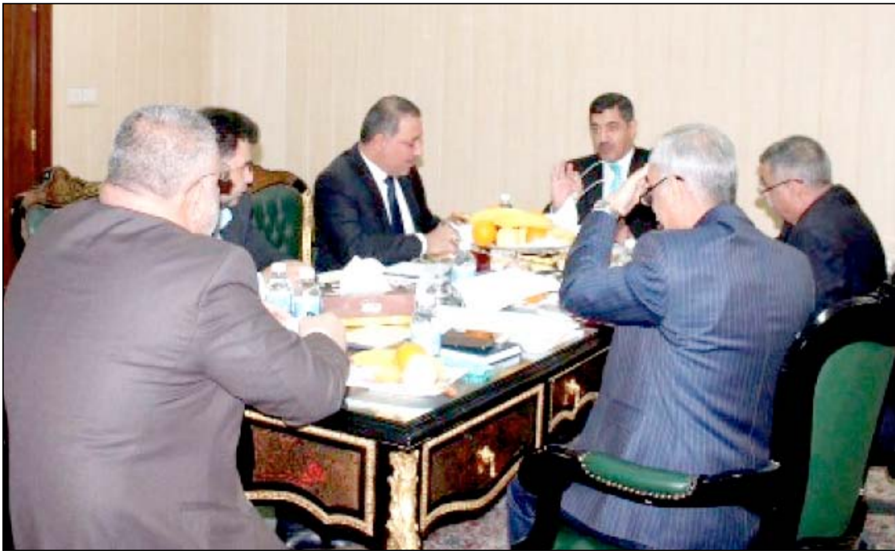
رئيس هيئة المساءلة ونواب برلمانيون في لقاء سابق.. (أرشيف)

أعدت أسماء 4000 مرشح إلى المفوضية بعد اكتمال تدقيق بياناتهم