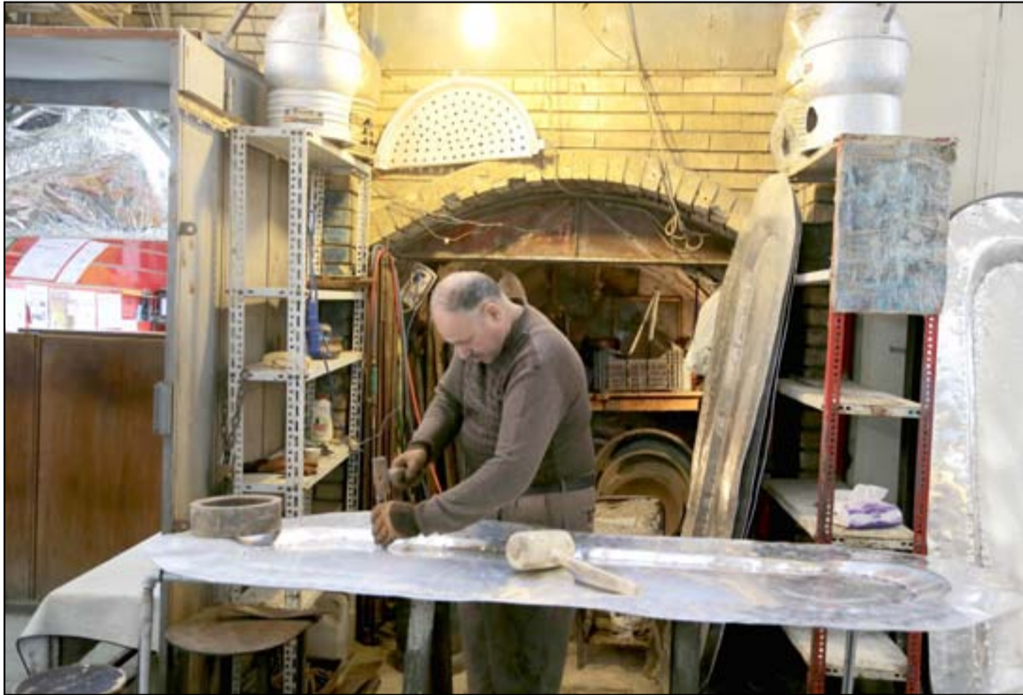
حرفي يقوم بالنقش على النحاس في سوق الصفاير وسط بغداد.....