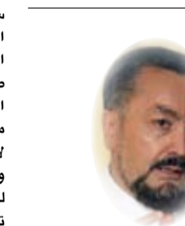
□ هارون يحيى