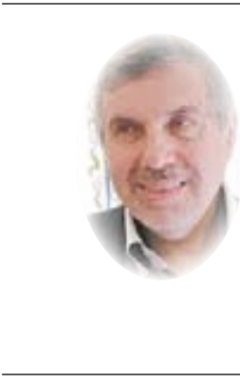
□ د. محمد توفيق علاوي

والكثير منهم صار من الفاسدين، فيما بقي الكثير من الأكفاء خارج العراق ولم يعودوا بعد اكتشافهم الدرجة العالية من الفساد المستشري، وخوفاً من عمليات الإغتيال المبرمج للكفاءات، ولهدا نشأت فكرة سيئة عن مزدوجي الجنسية ممن عادوا الى العراق، إذ كان أكثرهم من الجهلة ومن الفاسدين، أما الجيّدون فلا يرغب الغرب بالتخلي عنهم وعودتهم الى بلدهم، وقد أخبرني الدكتور إبراهيم الجعفري عندما كان رئيساً للوزراء، أن رئيس الوزراء البريطاني السابق (توني بلير) طلب منه ألا يسعى لإعادة الأطباء العراقيين الى العراق لأن بريطانيا بحاجة مأساة إليهم.