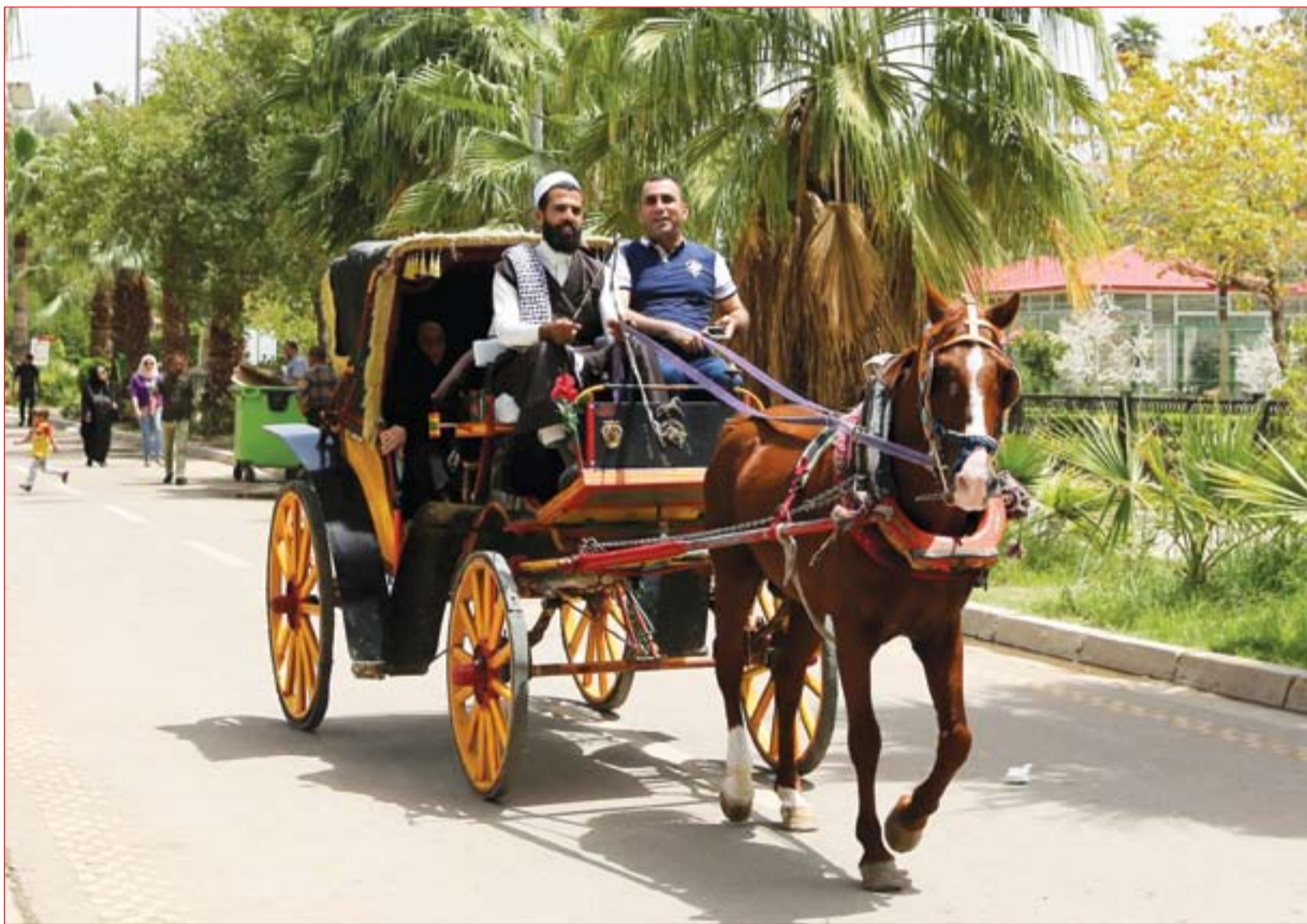
رغم حرارة الجو العوائل تنزه في حديقة الزوراء..... عسدة: محمود رؤوف

السياسية، إذ صوت البرلمان في الخامس والعشرين من شهر تشرين الأول الماضي على أربع عشرة وزارة ثم صوت بعدها على وزارات أخرى ليكون المجموع 18 وزارة مصوناً عليها من أصل 22. ويضيف العيساوي لـ(المدى) أن "جدول أعمال الجلسات الثمان المتبقية من الفصل التشريعي الثاني لم تتضمن فقرات للتصويت على الوزارات الأربع الشاغرة"، معتقداً أن "هذا الملف سيتم ترحيله إلى الفصل التشريعي الثالث". ويوضح عضو لجنة الأمن والدفاع البرلمانية أن "المشاكل بين القوى السياسية مازالت قائمة ولم تتمكن الحوارات من إيجاد حلول لإنهاء