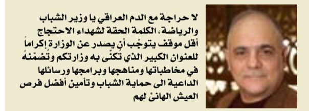
لا حرجة مع الدم العراقي يا وزير الشباب والرياضة، الكلمة الحقّة لشهداء الاحتجاج أقل موقف يتوجب أن يصدر عن الوزارة إكراماً للعنوان الكبير الذي تكتنّى به وزارتك وتضمّنه في مخاطباتها وبرنامجها ورسائلها الداعية إلى حماية الشباب وتأمين أفضل فرص العيش الهانئ لهم

يحتضن فندق كمبينسكي بالعاصمة القطرية الدوحة في الساعة الحادية عشرة ظهر يوم الثالث والعشرين من شهر تشرين الأول الجاري مراسم إجراء قرعة دورة كأس الخليج العربي لكرة القدم الرابعة والعشرين التي ستجري هناك خلال الفترة