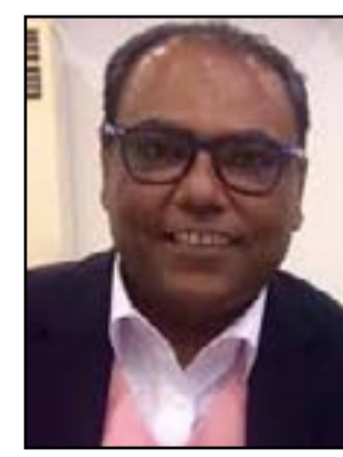
د. احمد شرجي

الفنان المسرحي يغادر الى دولة الكويت الفنان للإشراف على ورشة (الممثل الباحث) ضمن مشروع الملائم المسرحي والذي تنظله أكاديمية (لأيا الكويتية، والممثل الباحث هو الطريقة التي يقترحها شرجي لإعداد الممثل نظريا وعمليا وسبق له ان اشرف على أكثر من عشرة ورش للطريقة في كل من المغرب، تونس، هولندا، بغداد، وستكون الكويت المحطة الاولى خليجيا لطريقة الممثل الباحث).