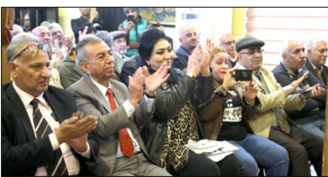
جانب من الحضور الغفير