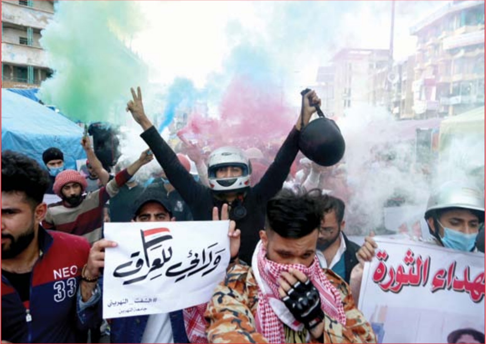
دعوات المليونية تعيد الزخم لساحات الاحتجاج..