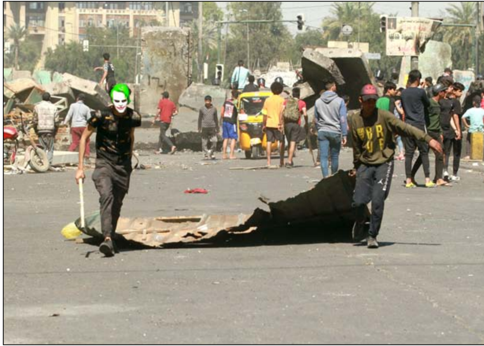
متظاهرون قرب ساحة الخلائي..

وكانت فرق الدفاع المدني، نفذت اكثر من حملة لتعقيم مخيمات المتظاهرين في ساحة التحرير، خوفا من انتشار المرض. وبالمقابل كان قد اشار اكثر من بيان صادر عن خلية الازمة (الحكومية) الخاصة بمتابعة فايروس "كورونا"، الى ضرورة "منع التجمعات".