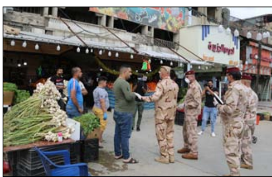
قطعات الجيش تتفقد الدينين خلال حظر التجوال...

مبكرة بشأن كورونا، فيما أشار إلى أن الإصابات بالفايروس قليلة على الرغم من موقع العراق الجغرافي. وقال مكتب عبد المهدي في بيان تلقى (المدى) نسخة منه "اللجنة العليا للصحة والسلامة الوطنية لمكافحة جائحة كورونا عقدت اجتماعها الأول برئاسة رئيس مجلس الوزراء عادل عبد المهدي"، مبيناً أنه "في بداية الجلسة تمت قراءة سورة الفاتحة على أرواح الضحايا والدعاء بالشفاء لجميع المصابين". وأثنى عبد المهدي "على جهود ونضحيات الملاكات الطبية والتمريضية وشكرهم باسم الشعب العراقي"، مشيداً بـ"جهود التوعية وحملات التطوع والتبرع والتكافل الاجتماعي". وقدم عبد المهدي شكره