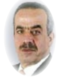
■ غسان شربل

غداً سيزعم كاتب أنه لمُ قبل أعوام إلى أن وبأء سيدهم الكوكب، وسيوزع ضحاياهم على القارات والدول. ولا غرابة في الأمر. سنعنا مثل هذه الاعاءات بعد انهيائ جدار برلين وانتحار الاتحاد السوفياتي. وغداً يطل مُنمَجٌ ليعيد تذكيراً بما يزعم أنه لمُ إليه في موسم سابق. وقد يعاتبنا مشعوذ لأننا لم نأخذ تحذيراته من الأخطار المحدقة بكوكبنا على محمل الجد. ولن يكون مستغرباً أن تطل جوفة باعة الأوهام التي تنصين أي منعطف ليقول إن النهاية أوشكت، وإن الإنسان الحالم المنتمد الجشع ارتكب ما يستحق عقاباً موجهاً ومريراً. لا غرابة في ذلك فقد دفع كورونا «القرية الكونية» إلى منعطف صعب لم نتوقعه ولم تحسن الاستعداد له، تشببه ما يجري بحرب عالمية ثالثة ليس دقيقاً، ففي الحرب العالمية كان يمكن العنور على ملاذات آمنة وحلفاء وجهات يمكنك الاتصال بها وتهب لنجدةك. المسألة مختلفة مع هذا الوباء. تواجهه وحيداً وعارياً من أي سلاح. لكن التشبيه يجوز إذا أخذنا في الاعتبار أن الفيروس سيقتل مؤسسات كثيرة علاوة على الأفراد. سيزرع استقرار حكومات وأسر ومدن حين يرمي بملايين الأشخاص في أقباص البطالة. أكثر من أي حرب أخرى، فتحت «حرب كورونا» دفاتر العزلة والوحشة والموت، وفي عزلة الانتظار الثقيل تتناسل الأسئلة الكفيرة وسات. أسئلة عن المصير الإنساني والحياة والموت لا تتسع أيام الرجل اللاهت وراء عمله لطرحتها. أسئلة عن الموت والخلاص وما بعد هذه الإقامة الأرضية والإنصاف والظلم وإصدار الأحكام. وكما شعر المواطن العادي