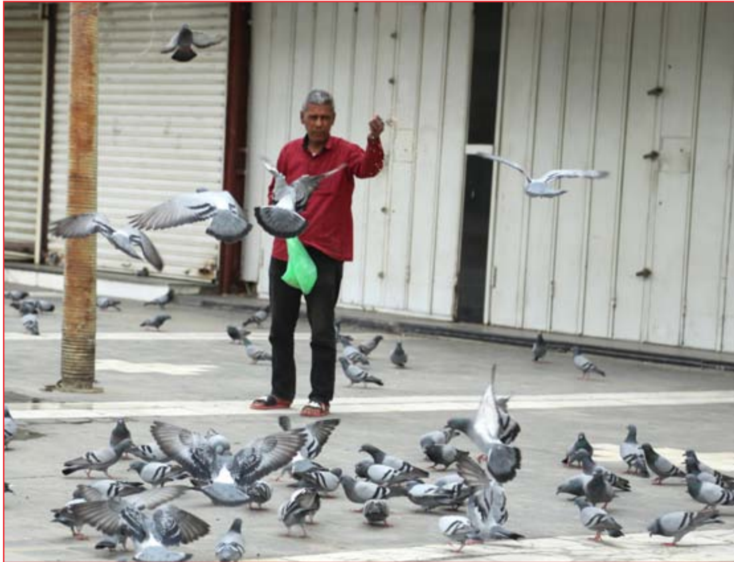
بغداد/ي اعتاد على إطعام الطيور في ظل حظر التجوال ..

وأزمة وباء كورونا الذي أثر على الحركة التجارية". وعلمت أغلب القطاعات الاقتصادية أعمالها في العراق تماشياً مع حظر التجوال الذي فرضته الحكومة مع تزايد الإصابات بوباء كورونا في جميع المدن والمحافظات العراقية، وبالتزامن مع هذه الأزمة هيبت بشكل مفاجئ أسعار النفط في الأسواق العالمية. ويعتقد ميرزا أن "تجاوز هذه الأزمة الاقتصادية على المدى البعيد يتطلب