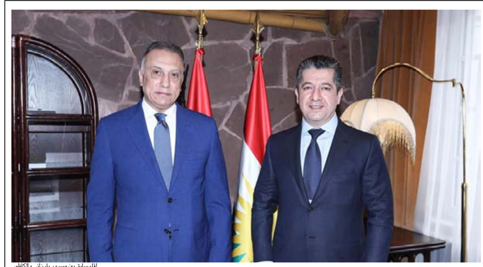
لقاء سابق بين مسرور بارزاني والكاظمي

وأضاف أن "حكومة إقليم كردستان قررت إرسال وفد برئاسة قوباد طالباني إلى العاصمة بغداد غدا (اليوم) الثلاثاء للتفاوض مع الحكومة الاتحادية لإجراء تعديلات على الاتفاق النفطي الموقع بين رئيس الحكومة السابق عادل عبد المهدي ورئيس إقليم كردستان نيجيرفان بارزاني قبل أكثر من سبعة أشهر".