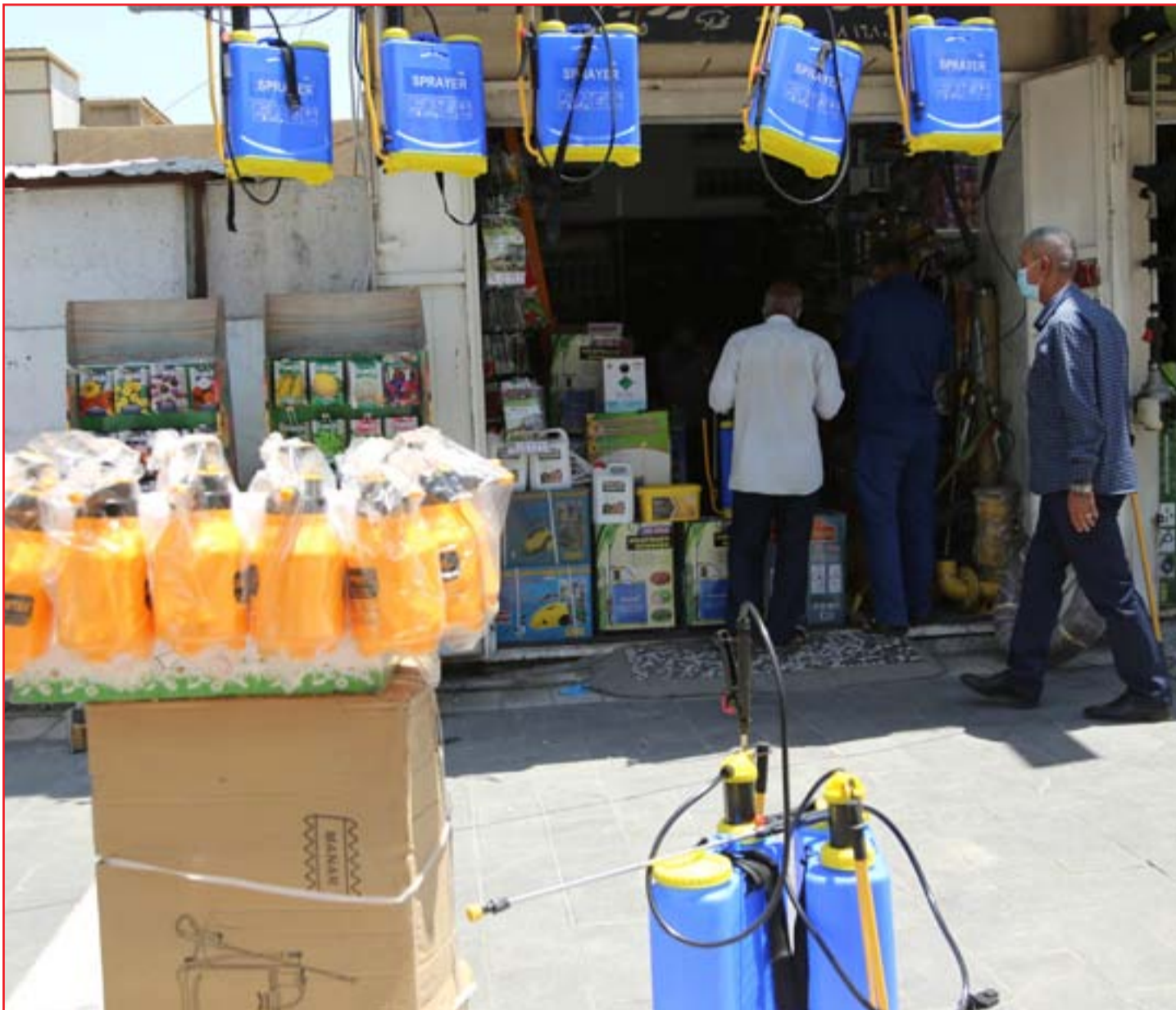
منتجات التعفير تلاحق رولجا في الأسواق .. (عساة: محمود رؤوف)