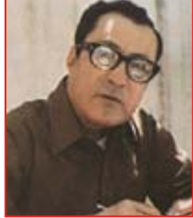
غانم طعمة فرمان

غانم طعمة فرمان الروائي والمترجم الكبير خصصت له مجلة بغداد الصادرة عن دار المأمون ملفاً خاصاً بمناسبة يوم المترجم العالمي عن دوره الثقافي ورواياته وترجماته التي قاربت المئة كتاب، ويذكر ان فرمان عمل لسنوات طويلة في دار التقدّم بموسكو حيث ترجم اهم روايات الادب الروسي بدءاً من تولستوي ودوستويفسكي مروراً بشولوخوف واينما توف وغوركي وعشرات غيرهم.