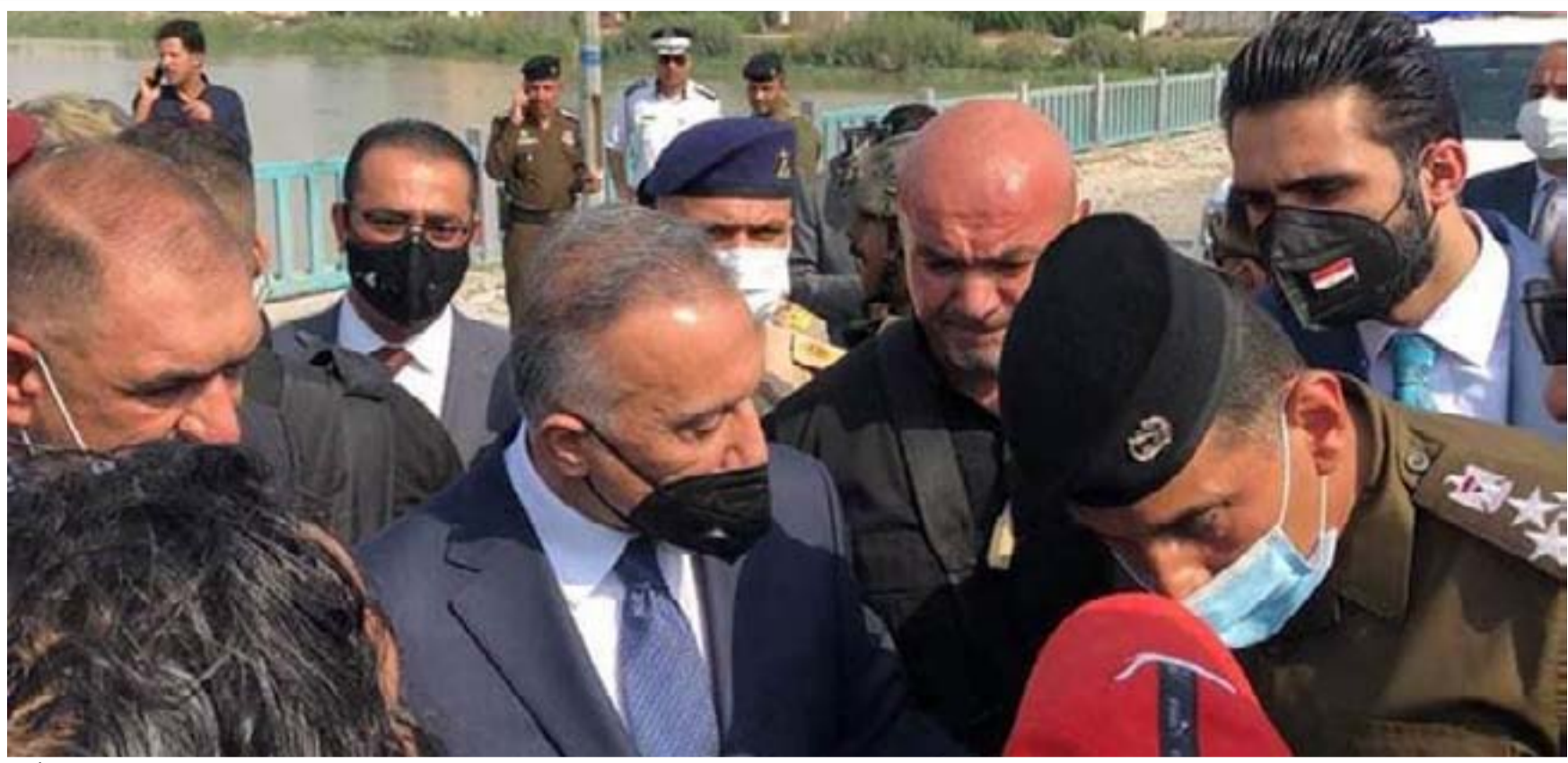
الكاظمي على جسر الزيتون في الناصرية أمس

على جسر الزيتون في الناصرية، الجسر الذي بقي شاهداً على أكبر المجازر التي لحقت بمحتجي تشرين، تعهد رئيس مجلس الوزراء مصطفى الكاظمي، أمس، بكشف قتلة المحتجين ومحاسبتهم. ووصل الكاظمي إلى الناصرية، صباح أمس، وعقد جلسة استثنائية لمجلس الوزراء حضرها أغلب الوزراء في المحافظة التي تفرق في بحر من الخريجين العاطلين عن العمل.