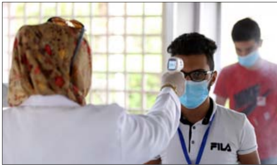
موظفة تجري فحص كورونا لطلبة عراقيين

وجاءت بغداد في المركز الأول من حيث عدد الإصابات الجديدة بـ 1480 إصابة، تلتها دهوك بـ 302، ثم أربيل التي سجلت 237 إصابة، فيما حلت محافظة المثنى بالمركز الأخير بـ 205 إصابة. أما حالات الشفاء فبلغت 4767 حالة، مقابل 60 وفاة جديدة. وبهذا يرتفع العدد الكلي للإصابات بفايروس كورونا في العراق إلى 382949 حالة منها 312108 شفاء، و9464 وفاة، ويتلقى 61327 مصاباً العلاج في المستشفيات بينهم 506 في العناية المركزة.