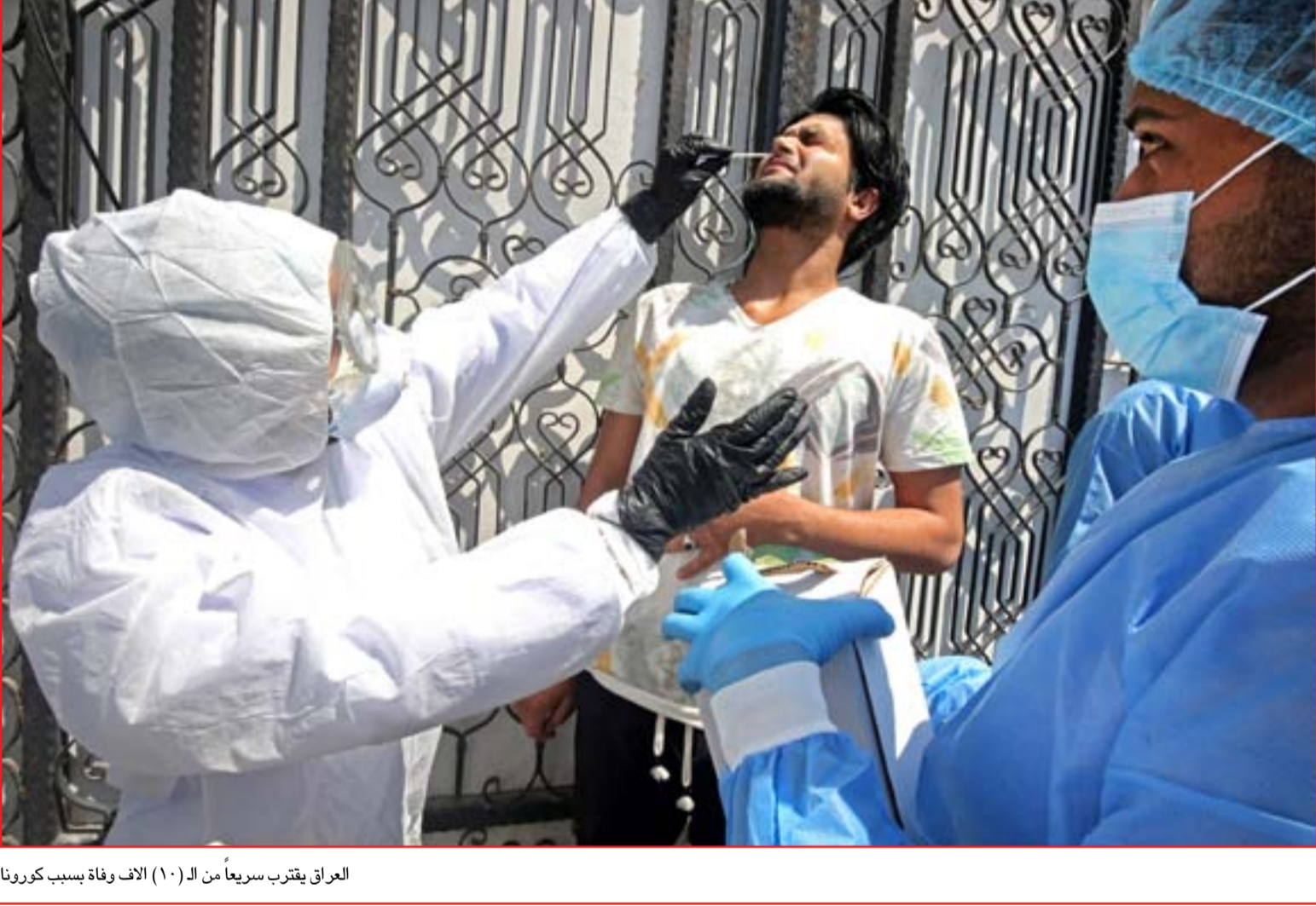
العراق يقترب سريعاً من الـ (١٠) الاف وفاة بسبب كورونا

7 باستضافة محسن الرملي.. نادي المدى للقراءة أربيل يناقش "بنت دجلة" أونلاين