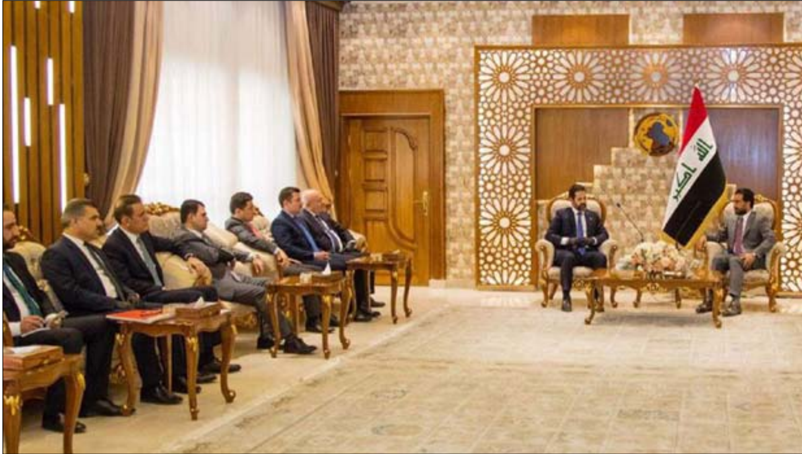
الوفد الكردي خلال لقائه رئيس البرلمان.. أرشيف

وفي وقت سابق كان رئيس الوزراء مصطفى الكاظمي، قد دعا مجلس النواب إلى عدم إقحام الخلافات السياسية في موازنة البلاد المالية. من جهته قال مازن الفيلبي، عضو اللجنة الاقتصادية في البرلمان، انه "بحسب المعلومات المتوفرة فإن المشاكل في الموازنة ستحسم خلال الـ8 ساعات القادمة". واضاف الفيلبي ان "هناك مشاكل فنية في الموازنة تتعلق بحصة اقليم كردستان وكيفية ادارة تصدير النفط، بالإضافة الى إيرادات المنافذ الحدودية".