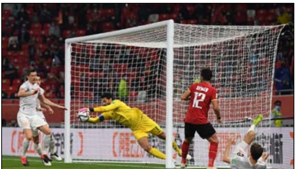
الدوحة تحقق نجاحاً باهراً في النسخة 2020 لمونديال الأندية