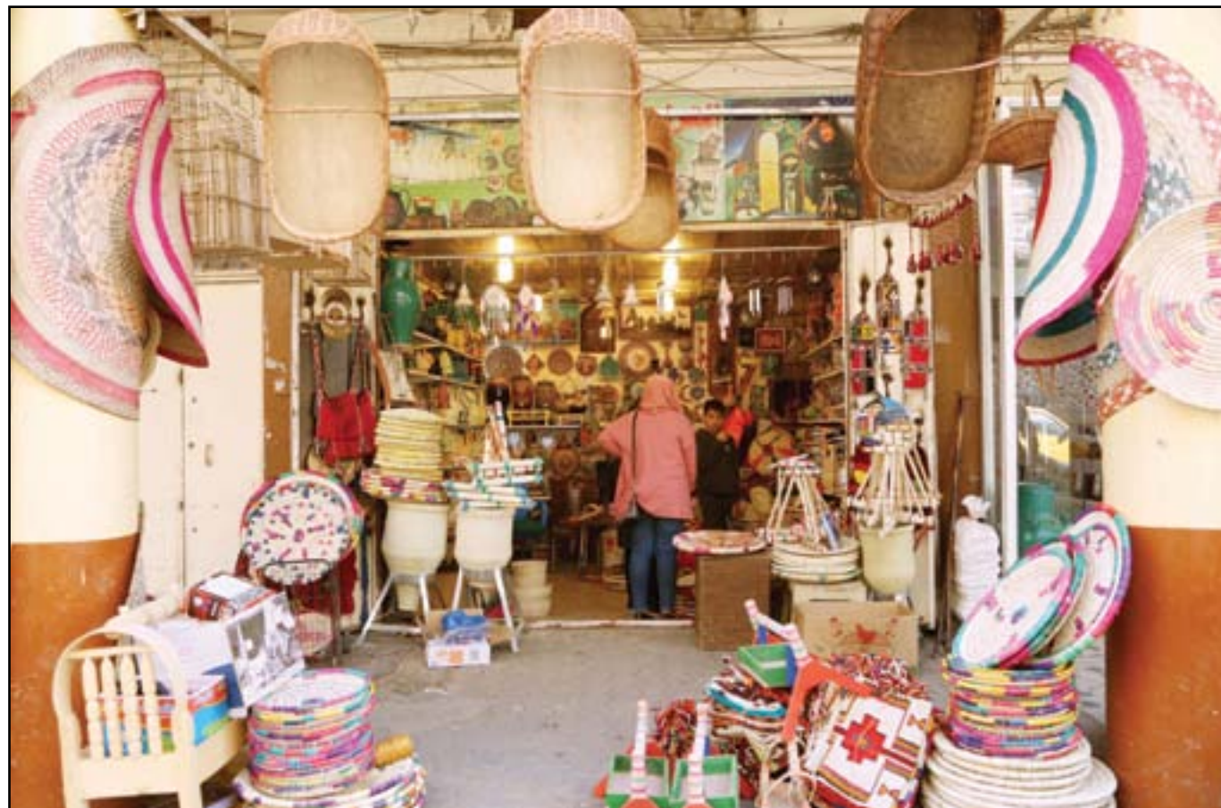
محل لبيع الانتيكات والاعمال اليدوية التراثية وسط بغداد... عسة: محمود رؤوف