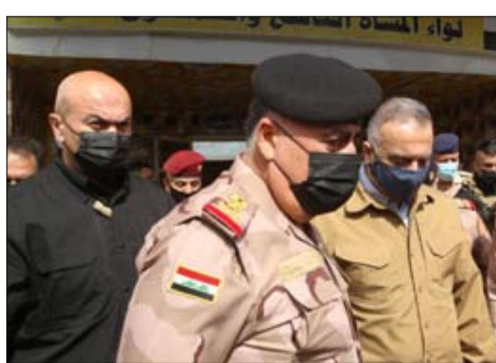
الكاظمي في الطارمية امس.

وأضاف البيان أن "قوة من فوج الطارمية التابع للحشد الشعبي استنبتت مع مجموعة من داعش، ما أسفر عن قتل ثلاثة داعش". وأشار البيان إلى أن "الاشتباكات أسفرت أيضاً عن استشهاد ثلاثة من مقاتلي الفوج واصابة اثنين آخرين، وما زالت الاشتباكات مستمرة".