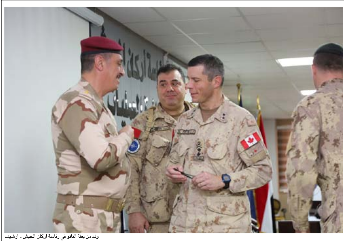
وفد من بعثة الناتو في رئاسة اركان الجيش.. ارشيف

وتهديد الولايات المتحدة". وتابع، أن "الشركاء الأوروبيون تصدوا لداعش، والناتو تبني مهمة التدريب في العراق". ومضى في حديثه "أبعث برسالة واضحة للعالم أن الولايات المتحدة عادت والتحالف عبر الأطلسي سيعود". من جهته أعلن وزير الدفاع الأميركي لويد أوستن، في مؤتمر صحفي، في اليوم نفسه أن توسيع مهمة حلف الناتو بالعراق كانت بناء على طلب الحكومة العراقية.