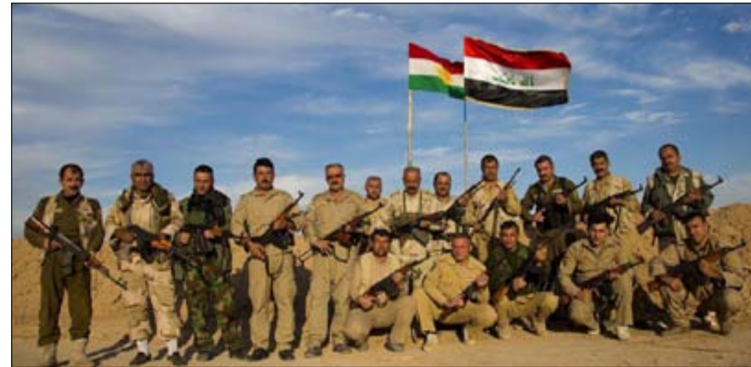
قوة من الجيش والبيشمركة خلال ممارسة أمنية.. ارشيف

بتاريخ 24 كانون الثاني الماضي حدثت طائرة استطلاع للتحالف وجود كهفين في