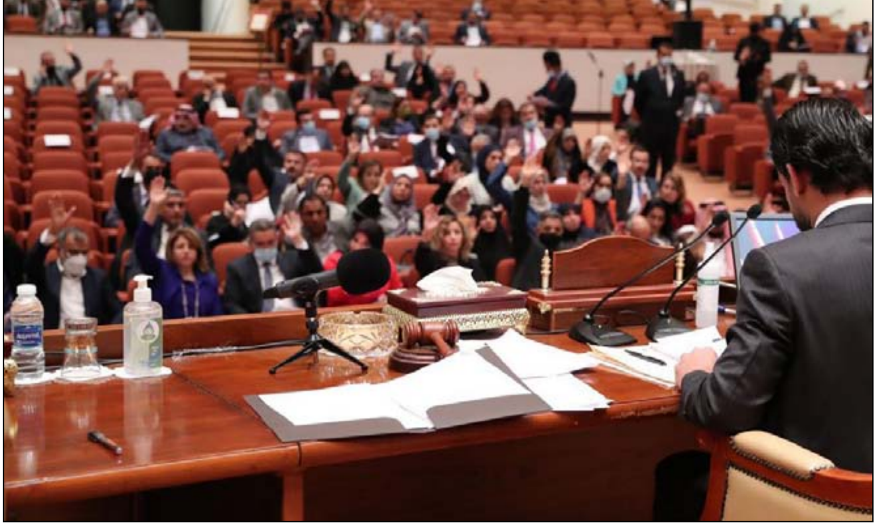
جلسة برلمانية سابقة.. أرفيف

تصب في مصلحة بنية الدولة والنظام الاقتصادي بصورة عامة". ويعبر الغيلي عن اسفه لـ"عدم الاخذ بهذه الملاحظات التي قدمتها كتلته الى مجلس النواب"، لافتاً الى أن "قرار كتلتنا منذ البداية عدم المشاركة في جلسة التصويت في حال عدم الاخذ