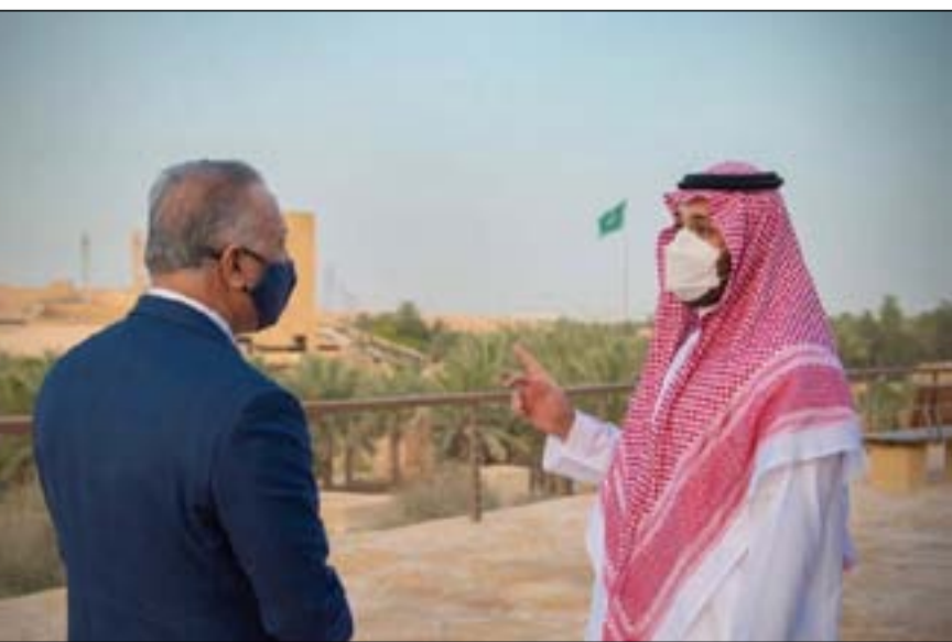
جانبا من زيارة الكاظمي الى السعودية

□ بغداد / المدى أعلنت خلية الاعلام الأمني، امس، أن طيران التحالف الدولي وبالتنسيق مع قيادة العمليات المشتركة نفذ ضربة جوية في وادي الثرثار بين صلاح الدين والأنبار. وقالت الخلية إن الضربة أسفرت عن تدمير كنف وقتل أحد الإرهابيين. وفي سياق متصل أعلنت قيادة الشرطة الاتحادية، تنفيذ عملية تفنيش والعبور على كميات كبيرة من العبوات الناسفة في محافظة كركوك. وأوضح بيان رسمي أن "قطعاً اللواء التاسع عشر الفرقة الخامسة شرطة اتحادية نفذت عملية تفنيش وتطهير منطقة الوسطانية ضمن ناحية الرشد بمحافظة كركوك، أسفرت عن العبور على كدس يحتوي على أكثر من 60 عبوة ناسفة ومسطرة تفجير بالإضافة إلى صاروخين كاتوشا، من مخلفات داعش". وأضاف البيان أنه "تمت معالجة المواد موقعا".