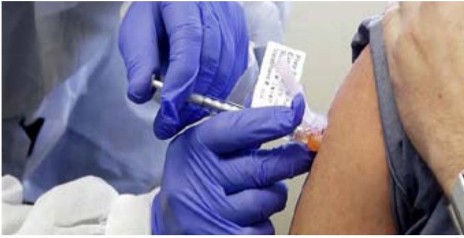
وقالت مراكز مكافحة الأمراض والوقاية منها إن الآثار الجانبية شائعة، لكنها خفيفة. إن حدوث استجابة مناعية، إنه أحد مستويات عالية من الحماية ضد الفيروس.

وقال مايكل ووربي، أستاذ علم الأحياء التطوري بجامعة أريزونا: "مع الجرعة الأولى، يتعين عليك توليد استجابة مناعية من الألف إلى الياء". وقالت مراكز مكافحة الأمراض والوقاية منها إن الآثار الجانبية شائعة، لكنها خفيفة. إن حدوث استجابة مناعية، إنه أحد مستويات عالية من الحماية ضد الفيروس.