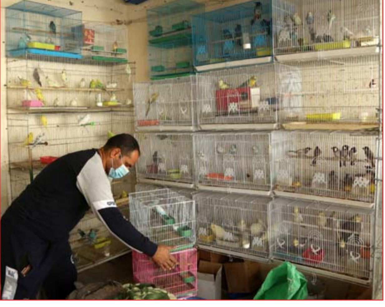
هواة الطيور في ظل حظر التجوال ... عدسة: محمود رؤوف

وقال: "أنا على يقين تام بأن الحضور السعودي على الصعيد الاقتصادي والتعاون السياسي وتبادل وجهات النظر سيلعب دوراً كبيراً في استقرار المنطقة واستقرار العراق". ولفت إلى "تدليل العقبات" في علاقات بغداد الخارجية،