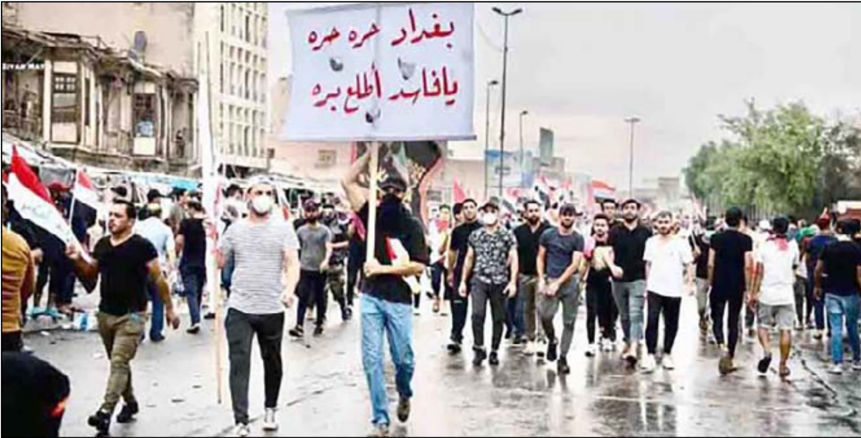
تظاهرات سابقة في بغداد

ويوضح الهندي السبب وراء توزيع المظاهرات في حديث لـ (المدى): "نريد تشتيت انتباه المندسين والاحزاب التي نعلم جيدا انها ستكون بانتظارنا في ساحة التحرير". منذ انقلاب الصدرين على الاحتجاجات مطلع ٢٠٢٠، وتورط اصحاب القبعات الزرقاء التابعين للقذافي الصدر زعيم التيار الصدري بضرب المظاهرين، تغيرت موازين القوى على الساحة، وباتت السيطرة الى التيار وبعض الفصائل. وكشف بعد ذلك عن وجود "خيم" في الساحة كانت تابعة لجماعات مسلحة، واخرى لاجهزة استخباراتية، كما سجلت عمليات طفق وقتل لمظاهرين مصدرها كان من قبل جماعات تجسس من داخل الساحة. وأواخر العام الماضي، نظم الصدريون صلاة جمعة في "التحرير" بعد شهر من انتهاء اعتصام المظاهرين وفتح الطرق اسام السيارات، كما استعرض التيار وفصائل مسلحة في الساحة نفسها قبل اسبوع، تنديدا بالرب على غزة. الناشط الهندي يقول ان "المظاهرين سيتوزعون منذ صباح الثلاثاء في