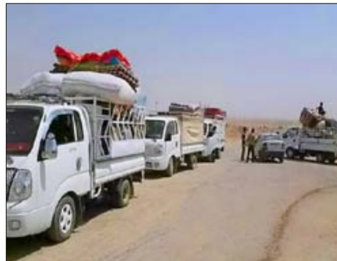
عوائل نازحة تعود لمنازلها

وفي حدث آخر ورد في التقرير وقع في شرقي الموصل تمثل بدخول ثلاثة عناصر من فصائل مسلحة عنوة الى مكتب أحد المنظمات غير الحكومية وهدوا أعضاء فريق المنظمة مطالبهم بإيقاف عملهم في المنطقة. واتهموا الكادر