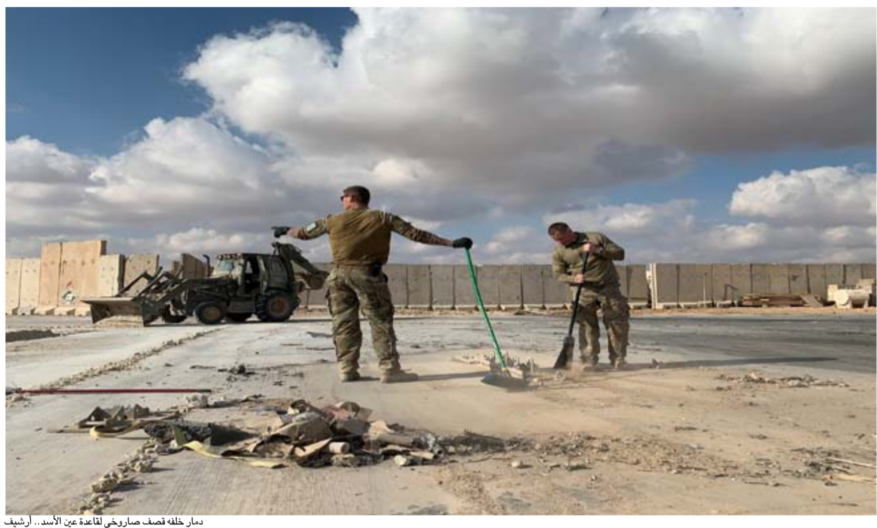
دمار خلفه قصف صاروخي لقاعدة عين الأسد... أرشيف