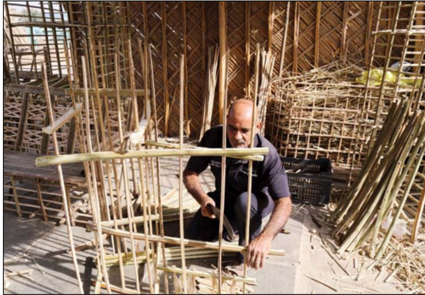
حرفي يصنع الأثاث من سعف النخيل في بغداد.. عدسة:محمود رؤوف

كشفت تقرير أعده مكتب تنسيق الأمم المتحدة للشؤون الإنسانية في العراق OCHA انه خلال شهر نيسان الماضي تعرضت منظمات إنسانية غير حكومية ومنظمات أخرى تابعة للأمم المتحدة الى مضايقات تراوحت بين متوسطة وشديدة عند نقاط تفتيش أمنية وأخرى تدار من قبل فصائل مسلحة في محافظات وسط وشمال العراق ووصلت وصول مساعدات الى مئات الألوف من المحتاجين من نازحين وعائدين. وجاء في تقرير مكتب الأمم المتحدة ان 24% من مناطق تمت تغطيتها في كل من محافظات وسط وشمال العراق في الأنبار وبغداد وديالى وكركوك ونيوى وصلح الدين، تراوحت فيها مصاعب الوصول للمحتاجين بين متوسطة الى شديدة.