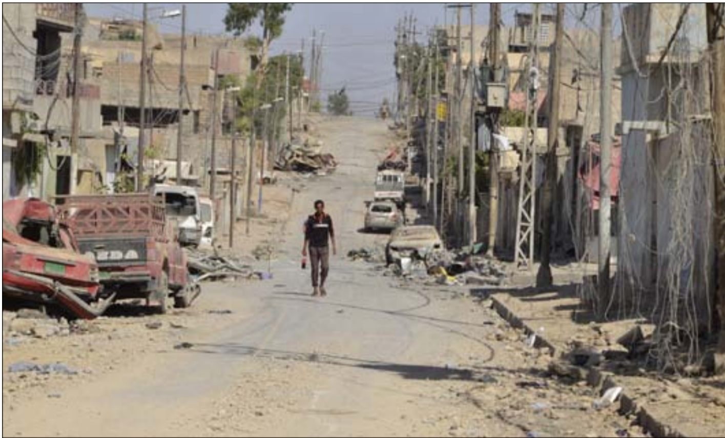
صلاح الدين تال نصيباً كبيراً من الفساد

٢٠١٨، لم يتم العثور عليها". كما كشف المحافظ عن ان أكثر من ٤٥ مليار مليار دينار "تم صرفها لسامراء خلال الأعوام الثلاثة السابقة، منها تطوير مداخل المدينة بكلفة (١٠،٤) مليار دينار) "دون إنجاز فعلي" واكد جبر في تصريحات سابقة هدر مبلغ ٤٠ مليار دينار "منحت لستة مهندسين لبناء مدارس في المحافظة لم تنجز حتى الآن. وأوضح المحافظ، أن "٢٠٠٪" نسبة أرباح المشاريع السابقة في