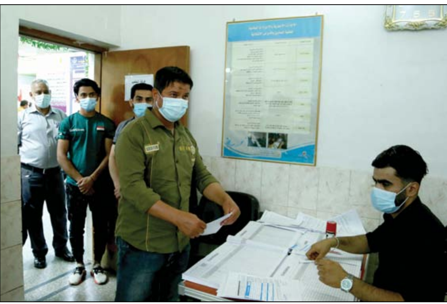
تزايد الإقبال على لقاح كورونا.. الصحة: الأعداد دون المستوى المطلوب

■ بغداد / تميم الحسن قرر 20 نائباً من أصل 29 في محافظتي ذي قار وميسان خوض الانتخابات التشريعية المبكرة المقترض اجراؤها في تشرين الاول المقبل. بالإضافة الى 9 نواب سابقين عن المحافظتين، بعضهم نقل ترشيحه الى بغداد وأخرون استبدلوا كتلتهم بقوائم اخرى.